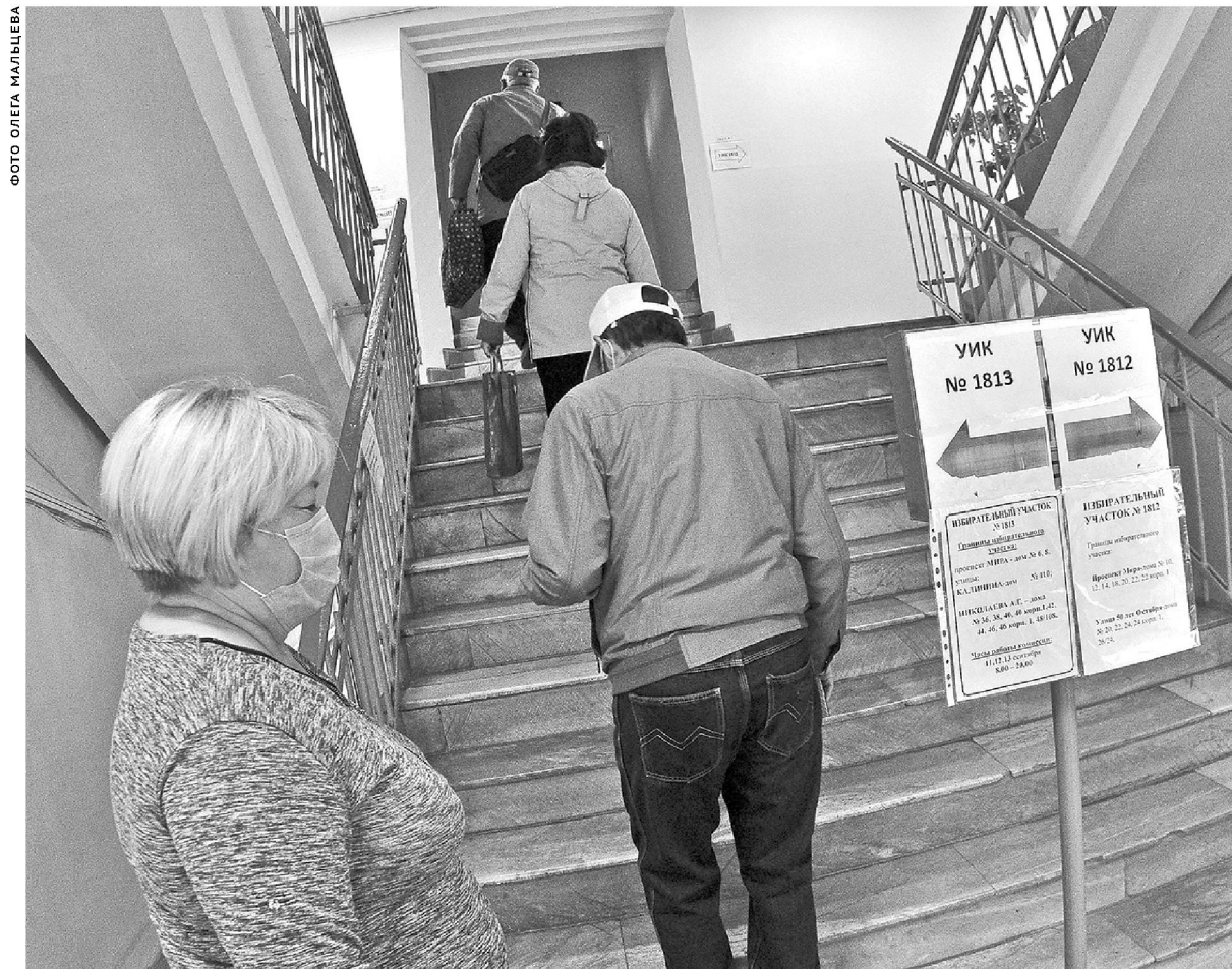
Поток избирателей на участки не иссякал все три дня.