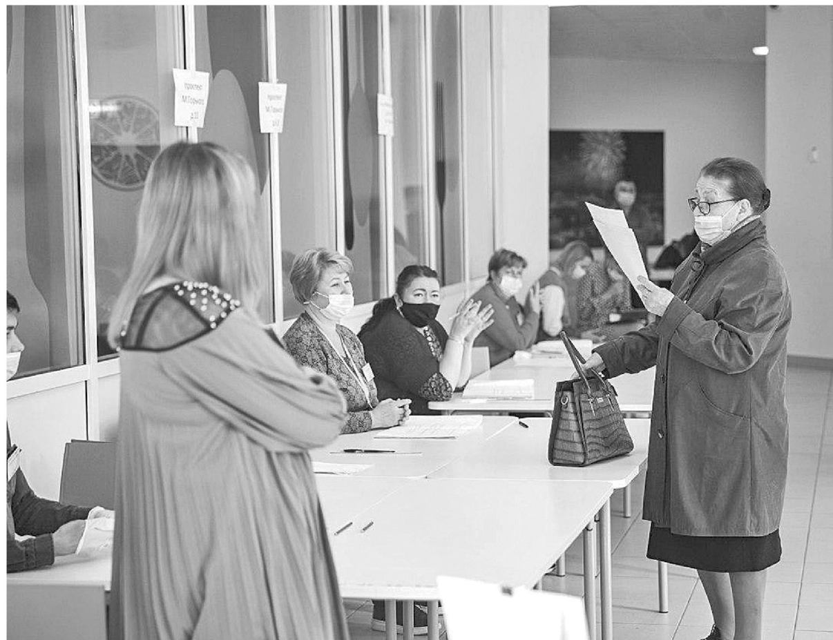
Как сообщили вчера на планерке в администрации Чебоксар, по предварительным данным, участие в голосовании приняли 43 процента избирателей города.

Подготовили Ольга Казакова, Елена Тры, Игорь Герасимов, Алена Оленова, Екатерина Казнина, Игорь Васильев, Семен Алицев, Владимир Васильев