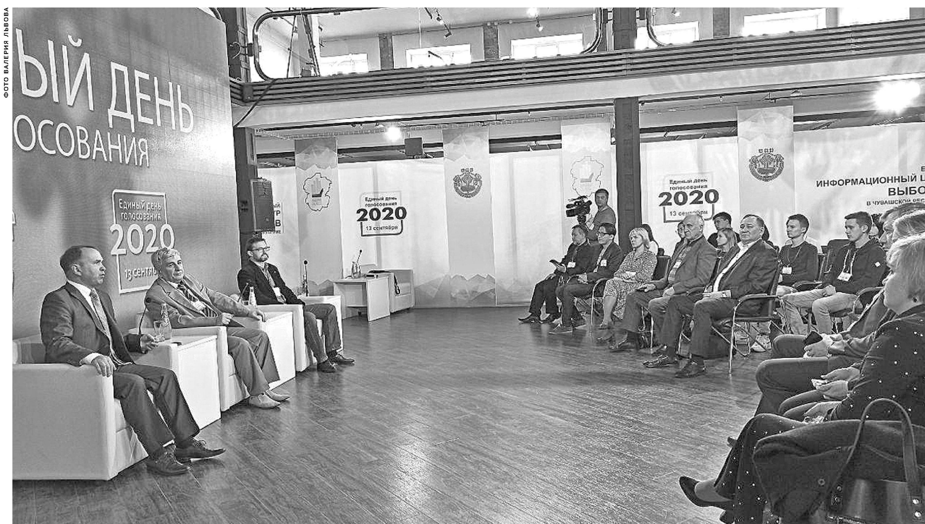
Единый информационный центр стал тем местом, где из первых уст можно было получить самые свежие новости о ходе голосования.