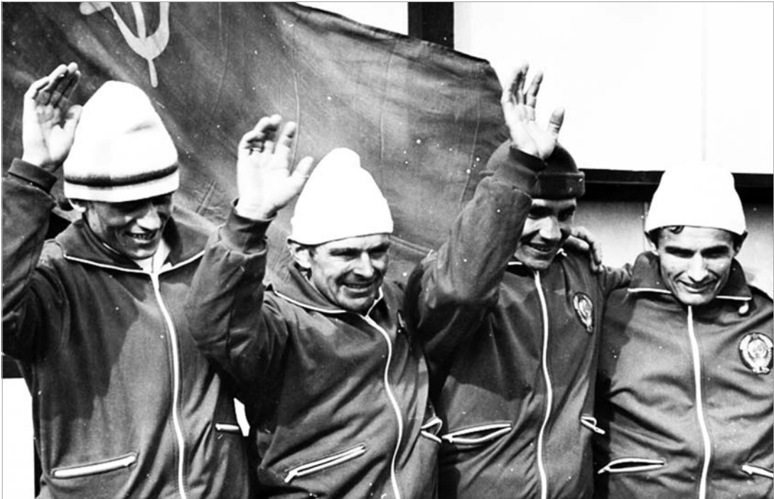
Та самая легендарная эстафетная команда. Слева направо: Юрий Скобов, Вячеслав Веденин, Владимир Воронков, Федор Симашев.

Единственный уроженец Чувашии – чемпион зимних Олимпиад Владимир Воронков, говорят, не любит иметь дела с представителями СМИ. Во всяком случае, никому из журналистов нашей республики не удалось в последнее время толком пообщаться с Владимиром Петровичем, который вышел на пенсию и в настоящее время проживает в одном из коттеджных поселков подмосковного Одинцова. Исключением здесь стало разве что большое интервью олимпийского чемпиона (между прочим, полковника запаса), размещенное на интернет-сайте членов московского товарищества офицеров «Сыны Отечества» – выходцев из Чувашии, служащих в составе различных родов войск. Мы решились опубликовать фрагменты этой беседы.