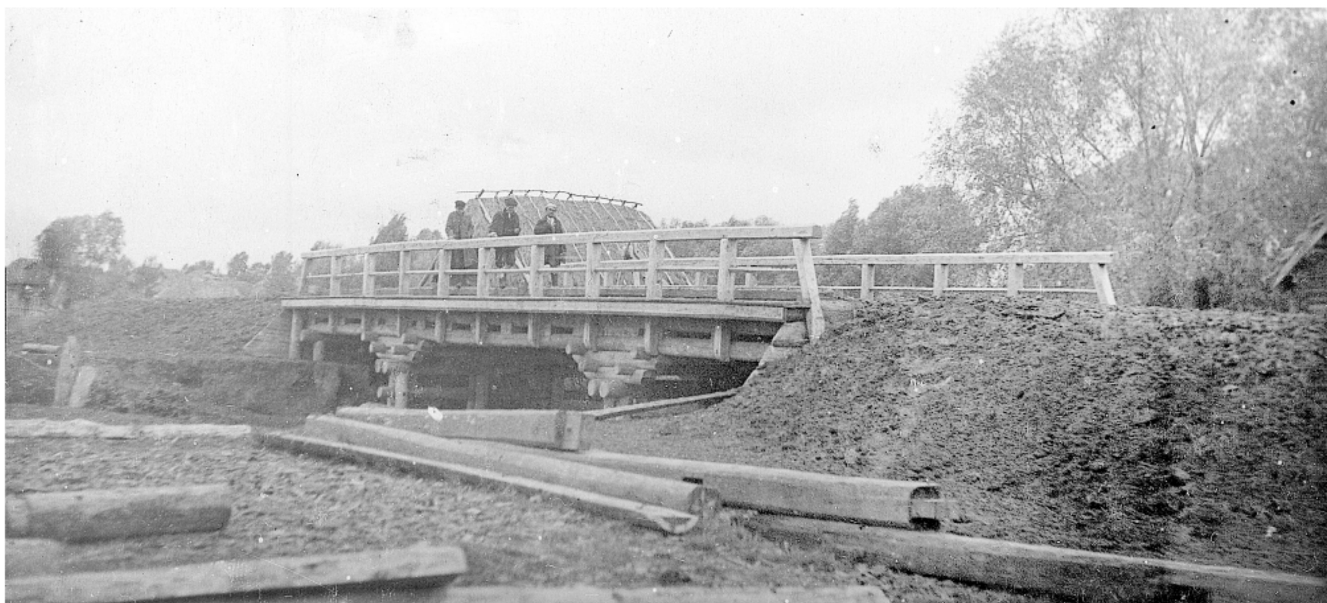
Мост и дамба у села Атнары Красно-Четаевского района, построенные «трудовым участием» населения. Начало 1930-х гг.