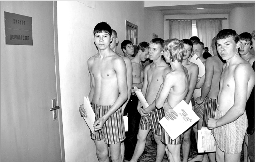
– Суркуннехи призыв мёнпе асра юлө?

2011 сулхи призыв тапхәрәнче Чәваш Енрен 3320 җамрака хәсмете тәратма паләртнә. Ҷав шутран 350-не – Шупашкартан. Ҷара кайма хатәрленекенсене мёнле сөнөләхсем кәтнине пөлме Чәваш Республикн җар комиссарпёле Александр Мокрушинпа тёл пултәмәр.