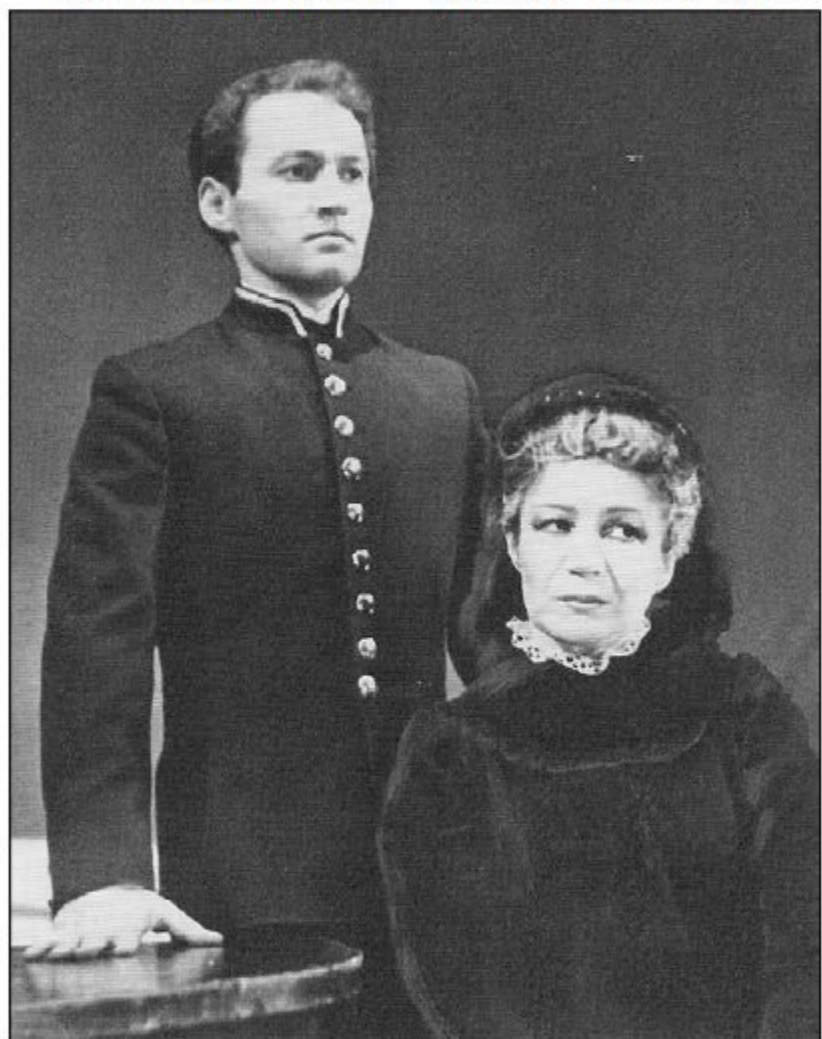
● «Хумсем сырана сапасĕ» ёсрен.