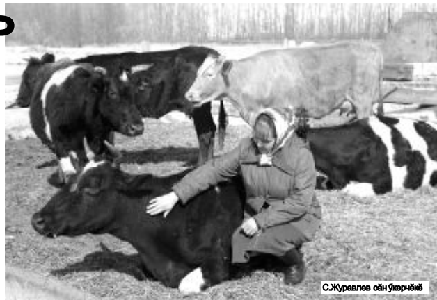
С.Журавлево сән укөрчөс

Бюджетран уйаракан укса ял хуҗалық предпритийсене түлеме те ситмест-мөн. Апат сахаллипе сынсеме те ытлашши выльақран хатәлма тарашни сисенет. Выранти предпритийсеме вёсенчен тивөстлө хакпа туянасн Чаваш Енре выльах-чёрлөх хисеплө чаксах каймө.