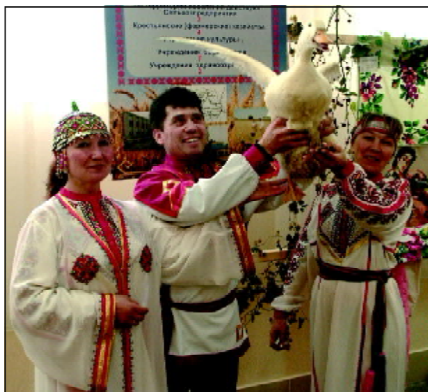
Невёсё. Пусл. 1-мёш стр. №.

Районти ёс укши шайё республикари ватам катартуран 25 процент таран пёч-ёк пулни тата тарашарах ёсleme хистенине палартрё. Вьльăх апатне сёр процентё пех пурнăсланнă хусалăхсем те сахал мар. Вьрăнта ситменнине ытти региона тухса хатёрленё. Халё те, ёсрен пушаннă май, вьльăх алачё кўрсё илме кая юлман-ха. Президент вьльăх-чёрлёх отрасльне аталантарастёйшле сёр сьвърмасар тенчё пек тарашнă «Новый путь» хусалăх ерт-