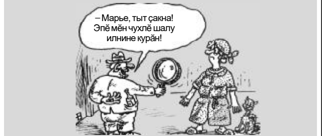
Кӕларӕма Рассей хӕсат-журналӕ тӕрӕх Е.НИКОЛАЕВА хатӕрленӕ.

Статистика кӕтартӕвӕсем тӕрӕх ирлӕн сул вӕтам ӕсуки 18,6 пин тенкӕ-пӕтаншӕнӕ.