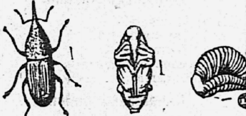
На рисунке—амбарный долгоносик жук (слева), его личинка (по середине) и куколка (справа) увеличенные в 6 раз.

Из числа этих вредителей особенно распространены у нас амбарный долгоносик, амбарная моль и зерновая моль.