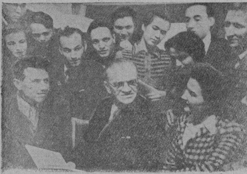
СССР тата ЧАССР халӕх артисчӕ М. М. Тарханов Мускаври театр искусствин институтӕнчӕ вӕрениӕ чӕваш ҫамрӕкӕсем хушшинчӕ.

лартнӕ. Уяв пуллӕ каҫкине МХАТ лартнӕ тӕрлӕ спектакльсен сыпӕкӕсене кӕртартнӕ, Станиславский Чеховӕн «Три сестры» пьесин сыпӕкӕнчӕ Вершинин рольне вылянӕ. Ҫакӕ вӕл сцениӕ ҫинчӕ выляма юлашки хут тухни пуллӕ. Чӕре чирӕ тӕрук тытса лартнипе, вӕл хӕйӕн рольне аран выляса пӕтернӕ, вара ҫавӕнтанпа сцениӕ ҫине актер пулса тухман. Чирленӕ хушӕра вӕл хӕйӕн теорилле ӕснӕ малалла туса пынӕ тата «Работа актера над собой» тенӕ кӕнеке ҫырма тытӕннӕ. Станиславский хӕйне профессорилле литератор тесе шуламан, анчах унӕн, литературӕ архивӕ питӕ пысӕк. Нумах пулмасть вӕл ҫырса хӕварнисене сакар том туса кӕларнӕ, анчах унта вӕл ҫырнисен пӕр пайӕ кӕна кӕнӕ.