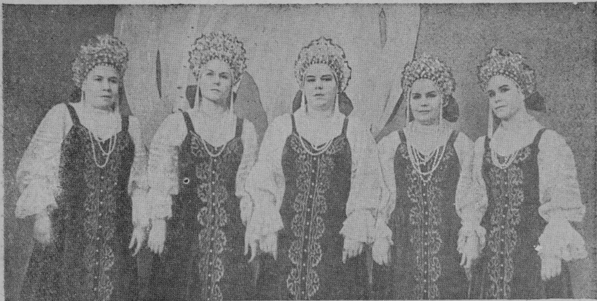
Пёр таван Федоровасем.

туса хунипе, мён пур рабочисен, хрѣсченсен тата интеллигендин ѣссене пёр тан условисенче автоматизациленипе тата механизациленипе пулать. Їака ѣынсене ас-тан ѣсѣпе вай-хал ѣсне пуриншѣн те пѣрешкел ыламштарса пыма май парать. Їапла вара, общества членѣсемшѣн кашниншѣнех творчествалла ѣслеме тата вѣренме лайах майсем уѣалаѣсѣ; ѣак кирлѣ ѣсре халах пурнаѣсне пурлах тѣлѣшѣнчен лайахлатса пыни, ѣс кунѣ кѣскелни, ѣынсен пурнаѣсѣпе йала условийѣссене ѣултан-ѣул лайахлатни питех те пыѣак вырѣан йышѣанса тѣрать. Анчах та, кашни ѣын культурапа пѣлѣ патне туртѣннине кирлѣ пек тивѣѣстермесѣн, ѣамрѣак ѣрава пѣтѣмѣшле тата политехникалла пѣлѣсем парассине ѣирѣппѣн пурнаѣсласа пымасан, ѣслекен халахан пѣтѣмѣшле пѣлѣ тата культурапа техника тѣлѣшѣнчи пѣлѣвѣн шайне ѣстерсе пырассине кирлѣ пек йѣркелемесен, ку ѣителѣксѣр пулать-ха.