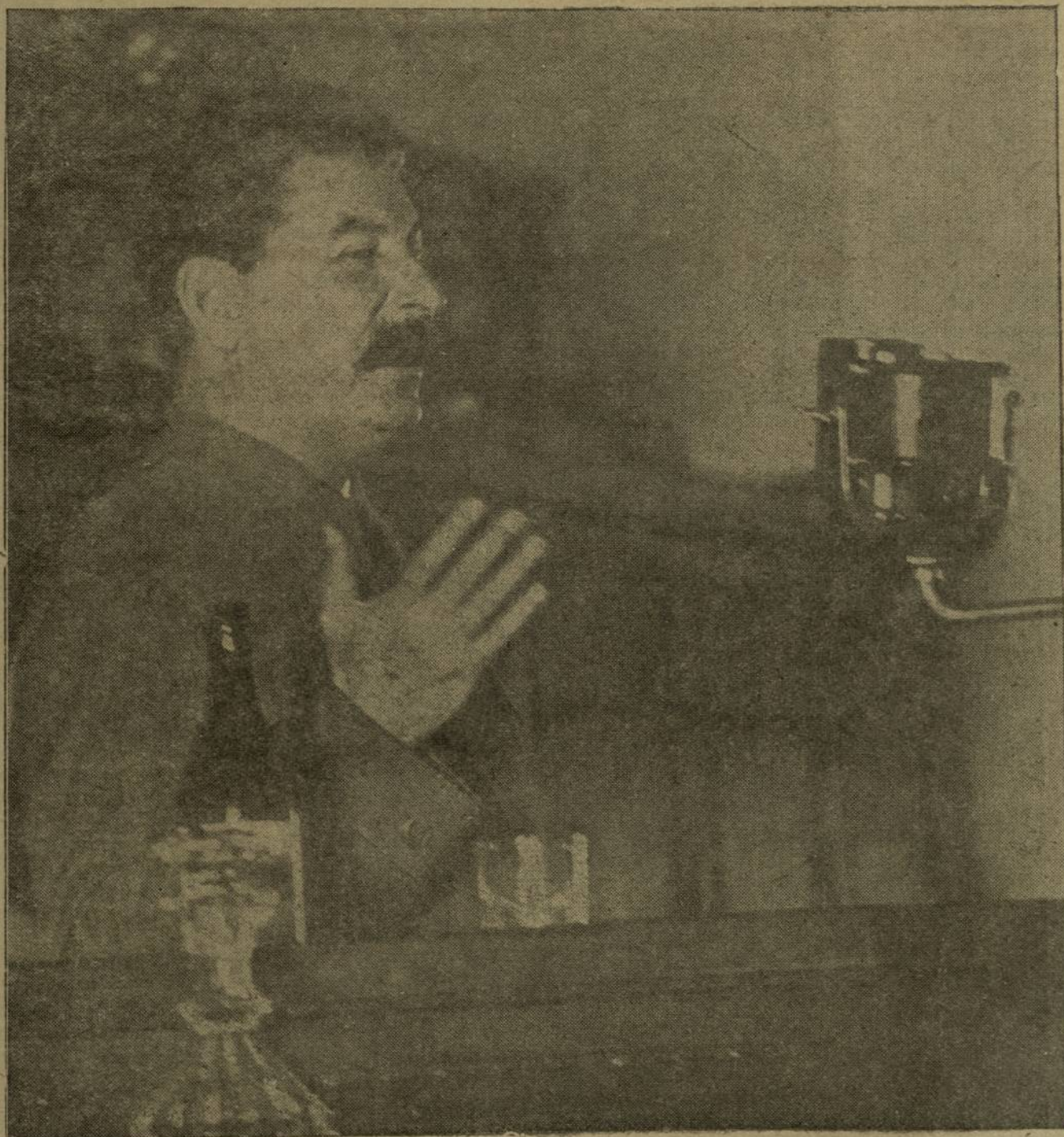
Укерчек синче: Пётём Союзри Советсен Чрезвычайла VIII-меш сйесёнке И. В. СТАЛИН йулташ ССРС Кон- ституци проекчё синчен доклад таваф.

ССР СОЙУЗЁН СТАЛИНЛА КОНСТИТУЦИЙЁ—ОКТАБЁРТИ СОЦИАЛИСАМЛА РЕВОЛЪУЦИ КЁРЕШЁВЁПЕ ФЁНТЕРЁВЁСЕН ИТОГЁ. СОЦИАЛИСАМ ФЁНТЕРЁВЁН ТАТА РАБОЧИСЕМПЕ ХРЕСЧЕНСЕН ДЕМОКРАТИН КОНСТИТУЦИЙЁ СЫВА [ПУЛТАР!