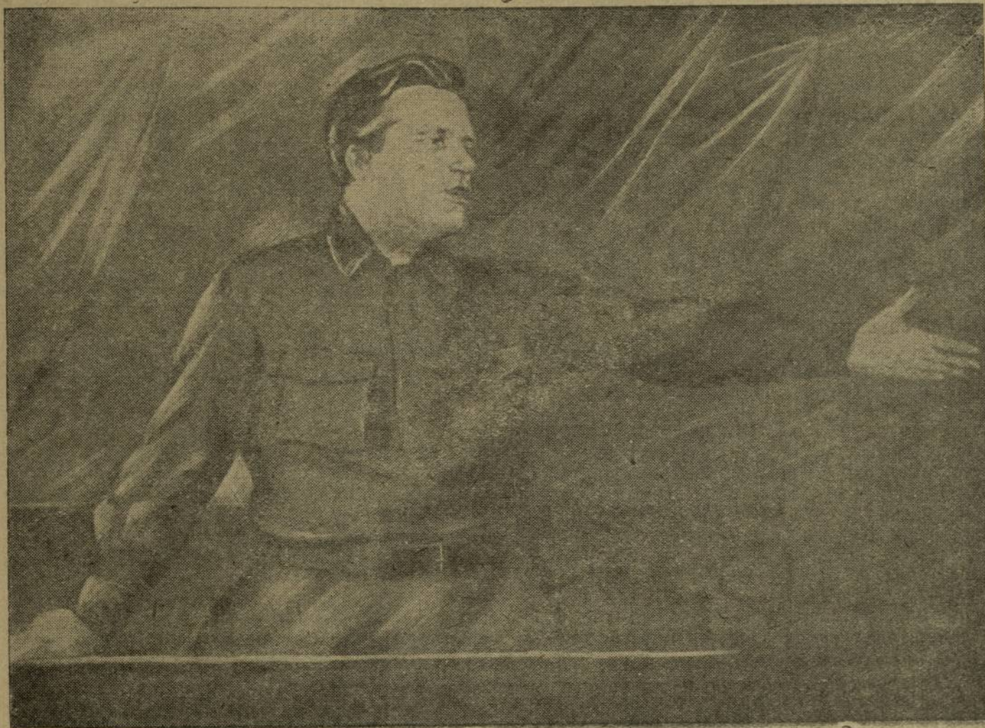
СЕРГЕЙ МИРОНОВИЧ КИРЎВ

Зверёв художник картинё.