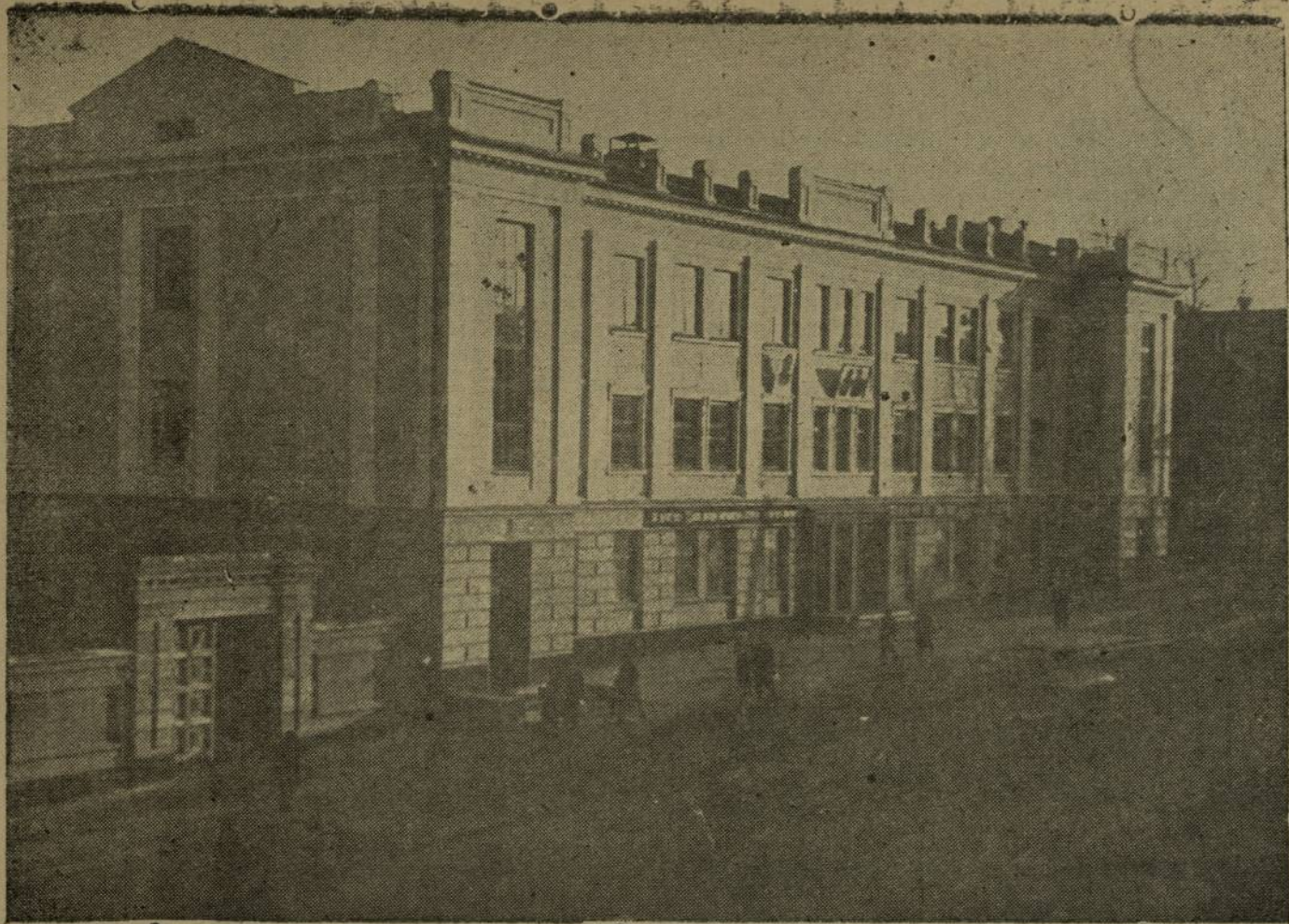
Ўкерчѣк сине: Чăвашсойузăн Шупашкарти сѣнѣ сурчѣ.