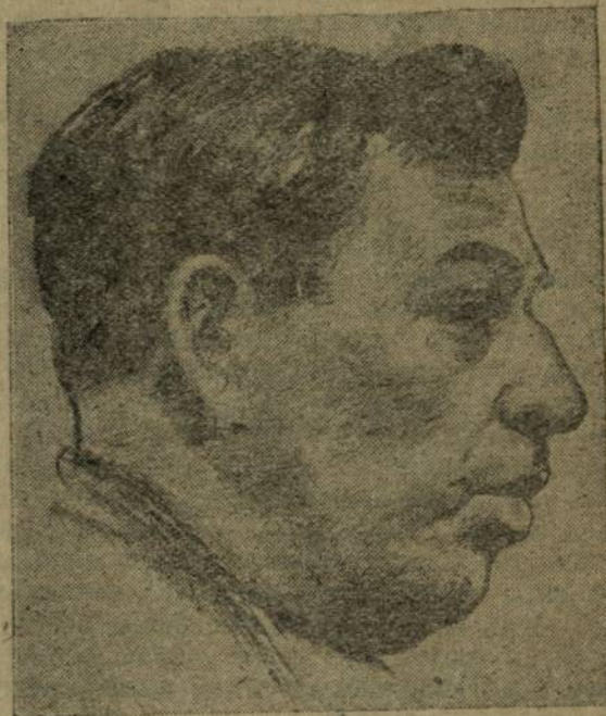
Буров йулташ. (ПСК(б)П Горьки Крайкомён представитёле).