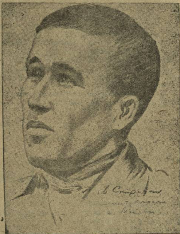
Майрин (Канаш р-нӧ.)