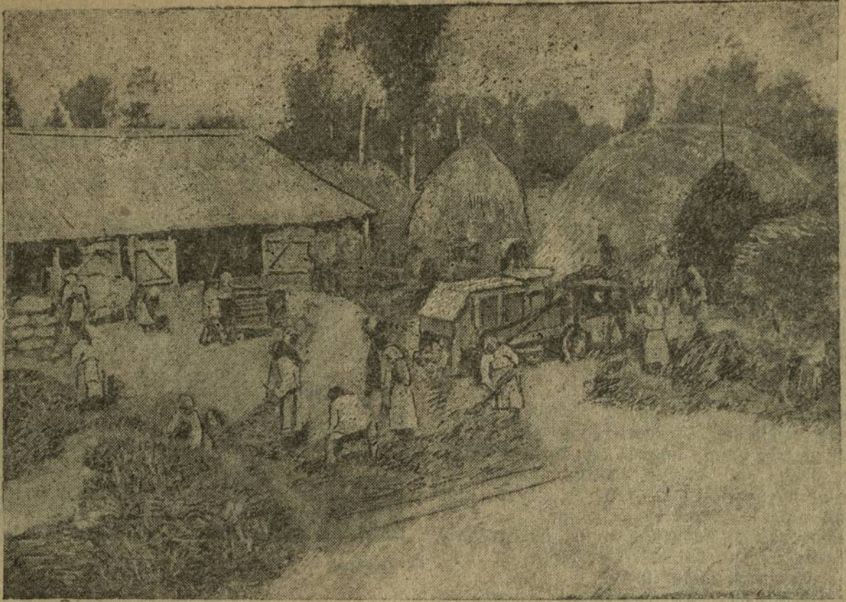
Колхоз йетемэ шинче ёс вёрет. „Сёне Йункә“ сентябёрён 8-мөшө тёлне пур тырра та сапса пётөрвө,

Ывтәнағ сөс хумлән-хумлән Йурә кулә пёр вёсрен. Сёне чуңлә „Сёне Йункә“ Савнашкал ёнтё, атсем.