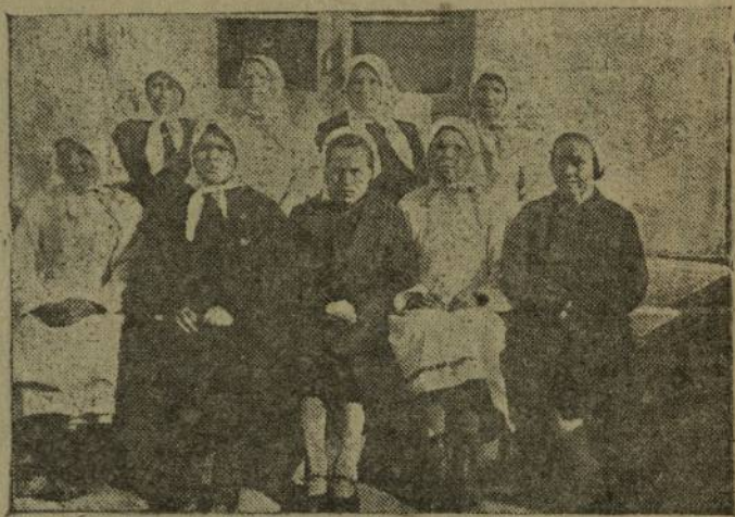
Республикри волхозник ударниксен 2-мөш сийесе — Тутаркас районёичен пынә хөбарәм делег аткәсем.

синченех илсе хупласа пынә. Ку февраль — сәнәх уйәхөченех пөгсе ситет. „Нетрудоспособнайсен“ фәнчө пулман. Җавән пирки Укахви пөтөмпөх аптраса, колхозан сөнө председателё патне пырат.