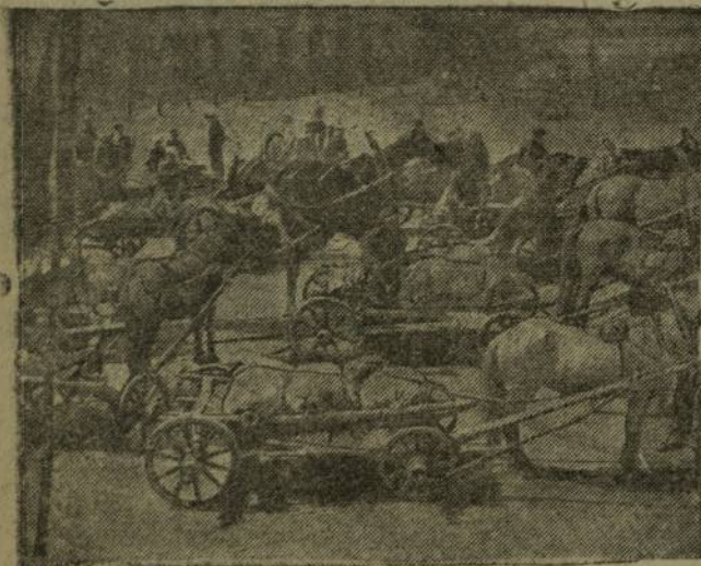
Хөрлө лав — Шупашкарта.

Укахви иртнө сұлта сү хута поварихәра ёслөнө. Хөрөх сыншан пөсерсен — аһа пөр ёсқунө панә, хөрөхрен кайа пулсан — процент тарых. Тырә ырсә кертес вәхәг ситиччен куллен 10—15 сынан ытла апат ситермен вәл. Җавәнпа та сү хута ёслө-