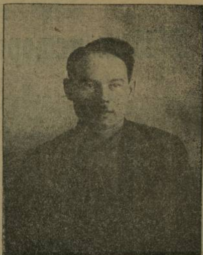
Телекат Алексѣйѣв Йѣтерне уѣс- тѣвком прѣтѣгаттѣлѣ.

Ку сѣсѣн итти сѣссенҫен уй- рѣмѣ пурри курансах тараѣ. Кунта, тѣ малтан, тѣваш ѣссынвисен прѣтѣставит- тѣлѣсем нумайтѣрах пухѣннѣ. Ку сѣсѣра пирѣн советсене тѣреклетеси сивтѣн сар ѣсѣ сивтѣн сѣтсе йавмалла пулаѣ. Кун пек ийтүсене елѣр пирвайхи хут советсен сѣсѣвѣ сѣтсе йаватпѣр. Пир- рѣн кунта советсене тѣреклетес ийтѣва тѣлѣсесе тухса, мѣн тувине, мѣн тумал- ливѣ шугласа хумалла, ситменлѣхсене тѣрлетмелли майсем тупса хѣвармалла пулаѣ. Сар ѣсѣ сивтѣн епѣр Советсен сѣсѣвѣ сѣтсе йавмантѣре, халѣ сѣтсе йавмалла пулаѣ. Вѣл мѣнтѣн килет? Пирѣн Совет Сѣбусне ыран-пайанах ташмансем хуҫарласа илессине кура мар епѣр сак ийтүва сѣс кун йѣрки- не кѣртепѣр. Совет власѣ халѣ сар шутне закарса пыраѣ. Ҫав майпа пир- рѣн умра салтѣва каймалли сѣмрѣксене сар ѣсѣне вѣрентес сатафрѣ тухса тараѣ. Ҫавѣнпа та ун сивтѣн пирѣн сак сѣсе- ра канашланмаллах пулаѣ.