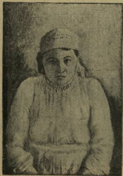
Сйес телегазё Халиме (тугар хёрапамё) Шанкартам вуласёвзё, Патёриёл уйесё.

Шупашкар—ёлёкхи ёмёрте даваш ёсхалэхёшён ыгла та савасар, тёксем хула, даваш ёсхалэхёне «палламасар», увтан машкылласа пураннй хула, сав Шупашкарах пайанхи кунсензё палламалла марах улшйвё, ыгла та саванасла, илемлё тум вёл тумлавнй. Даваш ёсхалэхё Асла Октапёр Революцион павй ирёксене сыхласа тарса, вёсене сйрёплетсе пырассишён кёрешине хййён тёп хулине, Шупашкарпа, сыхантарзё. 4—5 сул хушшинзё Шупашкар давах та даваш ёсхалэхён хулин сйя сапатне илзё, 4—5 сул хушшинзё Шупашкар давах та даваш ёсхалэхён кудьтурй венттарё пулса тарзё. Кунта даваш ёсхалэхё сак иртсе кайнй кёске вйхйгра, йавар саманара, мён тума пулгарни, мён-мён туса сётёрни