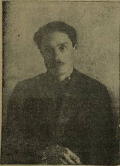
Курiev—Фёрлү уёстайком претсетатитёлё, сйес телегазё.

—пур те куранай. Рапфалё те, мусейё те, ватам шкулсем те, театтарё те, хаҗазё те, кёнеке кйларасси те... Даваш пёсхалэхён пётём пус мимийё Шупашкарта хаҗ... Ыгла та саванасла кунсем пурясса ирттерзё Шупашкар сак иртвё кунсензё. Вёт даваш тёп хулине даваш сёрён пур тётгём кёгесинзё те даваш ёсхалэхё уйрса йаия сйнесем даваш ёсхалэхён пуранасне хйпартасси сйинзё, йа тётгём шйгакран тухма пулшса, сута пуранас судёпе мёвле майсемпе илсе пырасси сйинзё сйтсе йавиа пухавзёс сак кунсензё даваш тёп хулине! Даваш республикён сёне, саврак, хаҗ анзак пуранма пуслакан Республикён 1-мёш Сйесё пулса иртрё вёт Шупашкарта сак кунсензё!