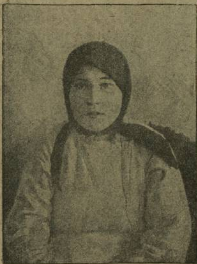
Сѣс телекаѣ Влагимирова Шѣ- вердѣс вѣласѣ, Шупашк. уйесѣ.

Халѣ ѣнтѣ пирѣн умра Тѣваш респулѣкне тѣреклетес, унѣн пурѣнѣсѣне лайѣх сѣлпа йарас сатафрѣ тараѣ.