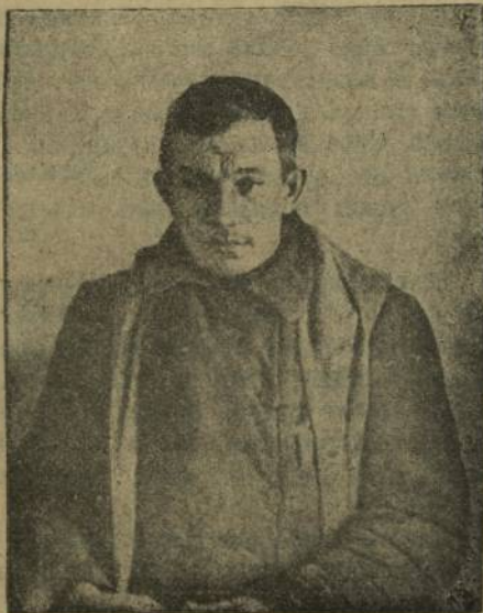
Карсанов.—Шанкъртам вулăс телекѓчё.

Тата сак сйесра елёр ѓаваш историвён ѓи палла ыйтува — Ъаваш республикєн тєп саккунне йышăвасър. Хамъран правитёлства суйласа лартас ыйту та бит палла ыйту пулса тѓраф