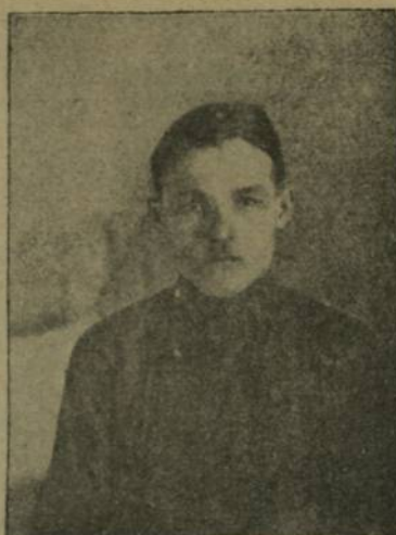
Телекат Ошплов, Евёшпуç вулётăвком преçсетатгелё Сёрпү уйёсё.

Факсем ёнтё дйаваш республикён Пёрремёш Сйесне уйрăм ырăни таратса, историре паллă ырăн йышăнтарса таракан ёсем.