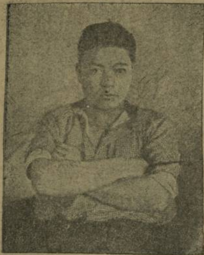
Телекат Сахаров „Иетинствă“ хабрăкленче ёслекен.

ёнтё. Ъаваш ёссыннисен пурăвăснє лайăхлатас ё; ѓаваш хусайствине вайлатас ёс сак ыйтува тёрёсрех туса иртернинчен те вилег. Кунта вилнё телекатсем сак ыйтусене тёллёрех сўтсе-йавса, лайăхрах шухăшласа туса пырассине шанса тарагър.