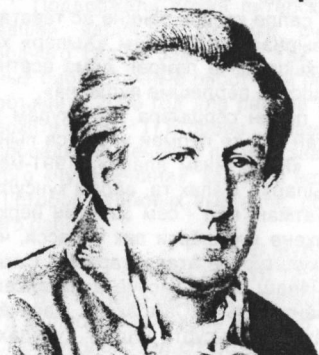
Петр Егорович ЕГОРОВ 1731-1789 г.г.

Уроженец чувашской земли, известный архитектор России, один из создателей раннего русского классицизма в зодчестве.