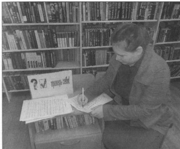
На уроке электоральной культуры молодые люди чувствовали себя уверенно

тали эрудитов предполагали весьма серьёзное содержание – знание избирательного права, правил проведения выборов, порядка голосования. Участники демонстрировали правовую эрудицию, физическую активность, чувство юмора, творческий подход, а также товарищеские качества. Первый тур начинался на площадке перед библиотекой. Эстафета «Предвыборная гонка» заключалась в заполнении бюллетеня голосования – победила та команда, которая быстрее всех поставила галочки напротив фамилий кандидатов. Роль эстафетной палочки играла шариковая ручка. После этого команды перемещались в актовыв зал, где приступали к конкурсам: на знание терминов – «Я – избиратель», фраз-перевёртышей – «Обратный процесс», на нестандартное решение предвыборной агитации – «Избирательный синквейн» (в стихах), на лучший имиджевый портрет/сценку – «Мой кандидат». Молодых людей увлекли динамика игр, их демократичность, возможность действовать в команде, испытать себя в роли лидера. Безусловно, подобные соревнования содействуют