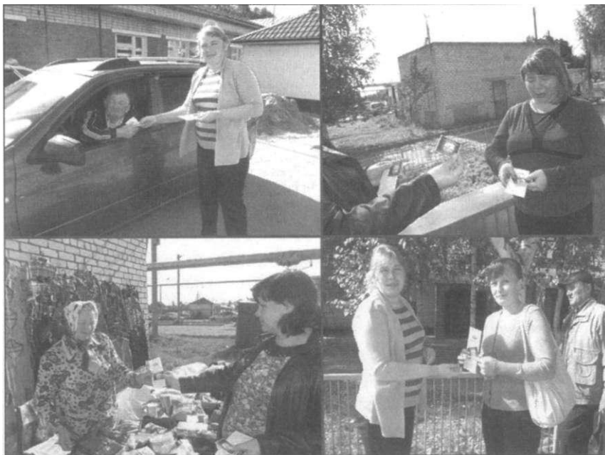
в рамках предвыборной кампании прошла уличная акция по распространению листовок

путём свободных выборов. Они содействуют формированию правосознания граждан в области избирательного процесса.