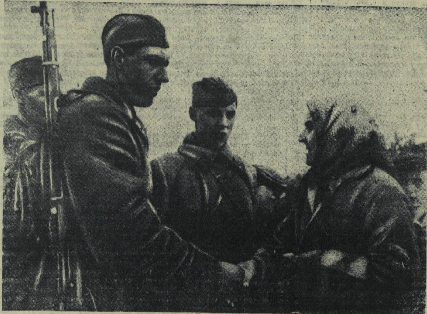
Встреча Красной армии с населением Западной Белоруссии НА СНИМКЕ: старая престылянка приветствует бойцов и командиров (м. Молодечно).

В своем аугле тов. Якубеков организовал ячейку общества по изучению Чувашстана, в которой состоит 174 человека.