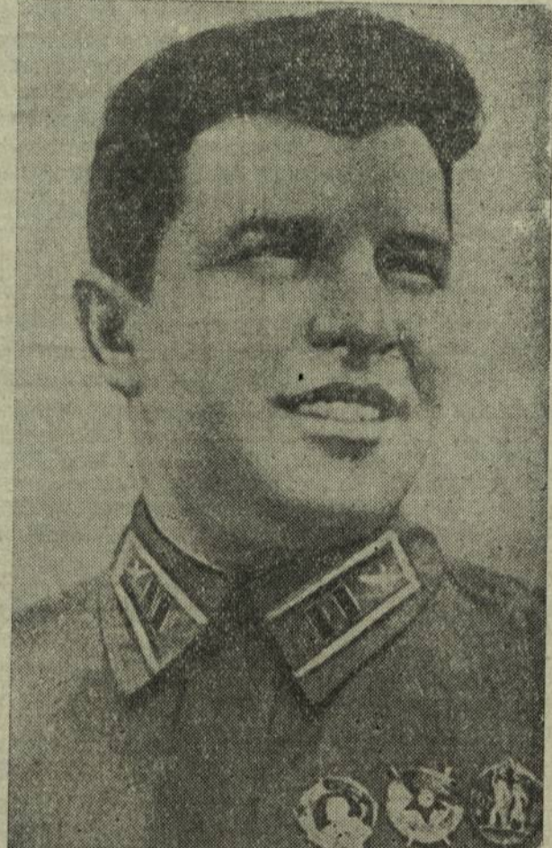
НА СНИМКЕ: Герои Советского Союза майор Г. П. Кравченко (слева) и майор С. И. Грицевец, награжденные второй золотой медалью «Герой Советского Союза».