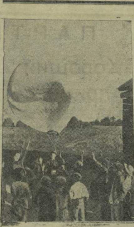
Слет авиамodelистов республики. На снимке: пуск шара Монгольфера.

Советское здравоохранение большое значение придает предупреждению болезней, профилактике. Известно, что многие болезни легко предупредить. К числу этих болезней относятся венерические болезни — сифилис и гонорея. Эти болезни излечимы, но для этого больной должен длительно и аккуратно лечиться. Иногда заболевание ведет даже к временной утрате трудоспособности. Между тем, если в первые 8 часов после заражения обратиться к врачу, то в громадном большинстве случаев развитие болезни можно предупредить. В цепи мероприятий по борьбе с венерическими болезнями эти функции возлагаются на так называемые «ночные профилактории». Это лечебно-учреждение не занимается лечением больных, а обслуживает только тех, кто обратился за помощью именно в первые восемь часов после предполагаемого заражения, т. е. собственно для профилактики, почему и называется профилакторием. До настоящего времени в Чебоксарах профилактория не было. Недавно при Чебоксарском вендиспансере организован профилакторий, функционирующий ночью. Организация ночного профилактория послужит дальнейшему снижению венерических заболеваний в Чебоксарах. Также же профилакторий необходимо организовать и в районных центрах Чувашии.