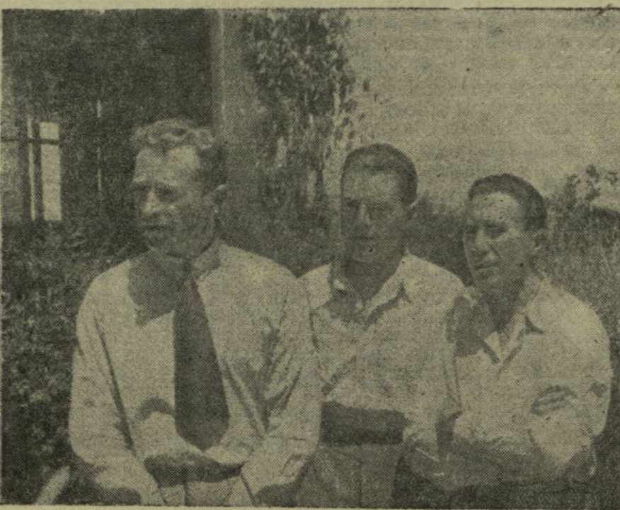
Сегодня исполняется первая годовщина со дня замечательного беспосадочного перелета по прямой по маршруту: Москва—Северный полюс—Соединенные Штаты Америки Героев Советского Союза М. М. Громова, А. Б. Юмашева и С. А. Данилина. На снимке (слева направо): Герои Советского Союза М. М. Громов, А. Б. Юмашев и С. А. Данилин в день посадки (14 июля 1937 г.) в саду офицерского клуба военного аэродрома в Марфиальде (Южная Калифорния).