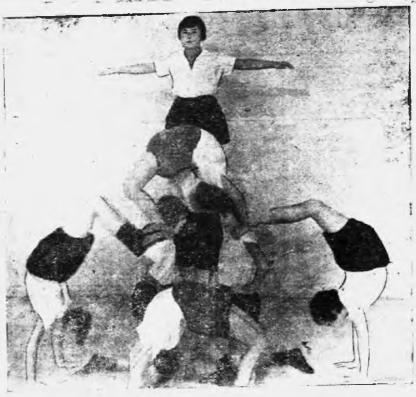
ЦИВИЛЬСКИЙ ДЕТГОРОДОК. Урок пластической гимнастики.