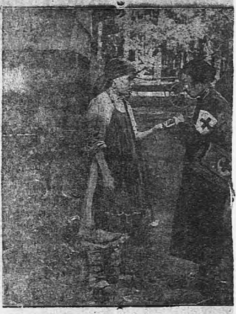
Медпомощь на дорожных работах

Селькоры и актив РККИ Семеновского сельсовета (Цивильский район) провели рейд проверки готовности к севу колхозов и единоличников. Рейд выявил явно неудовлетворительный ход подготовки к севу.