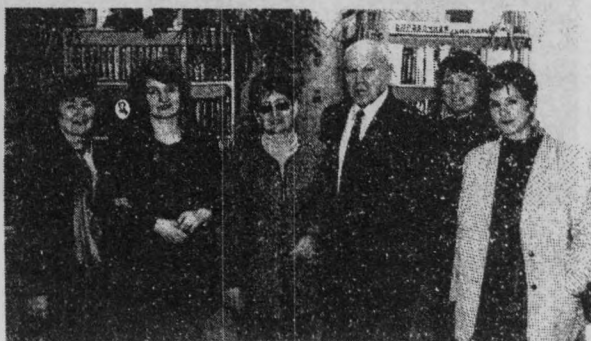
На встрече в Чебоксарском лицее №1.