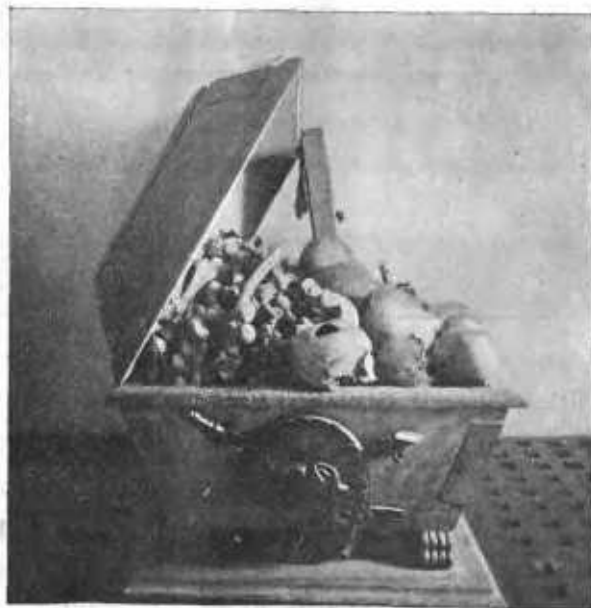
Гробница въ склепѣ подъ памятникомъ съ останками доблестныхъ русскихъ воиновъ, убитыхъ при взятіи Казани.

Когда все было приведено въ нѣкоторый порядокъ, послѣдовалъ торжественный въѣздъ государя въ покоренную Казань въ сопровожденіи бояръ, воеводъ, духовенства и ратныхъ людей. Государь вступилъ въ разрушенную крѣпость черезъ Тайницкія ворота и, водрузивъ крестъ на избранномъ имъ мѣстѣ, какъ знакъ побѣды Христіанства подъ магометанствомъ, повелѣлъ соорудить здѣсь храмъ — соборъ въ имя Благовѣ-