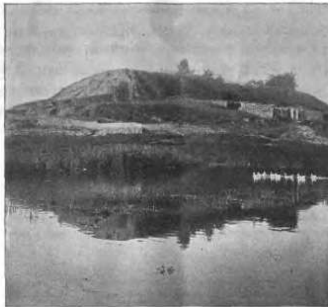
«Зилантова» гора съ восточной стороны и остатки «Змѣиного» озера въ Казани.

столицей разоренный уже къ тому времени великій городъ Булгарь, а рѣшили построить для столицы новаго царства новый городъ.