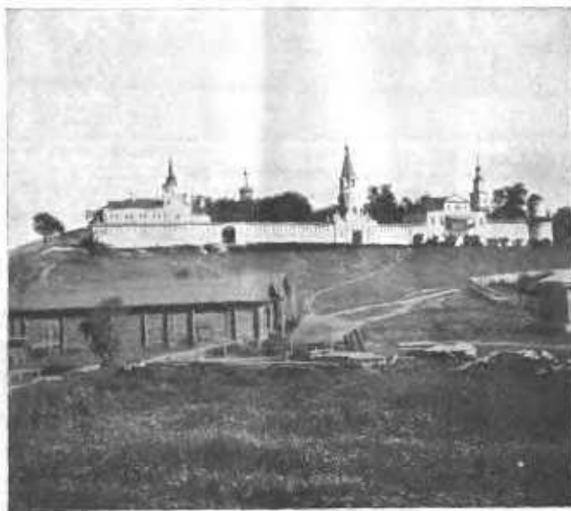
Общій видъ Успенскаго монастыря на «Зилантовой» горѣ съ южной стороны.

Надо было найти другое мѣсто для перенесенія города ближе къ Волгѣ, гдѣ были бы всѣ удобства для развитія торговыхъ сношеній съ разными землями, какъ было ранѣе въ Булгарѣ. Такое пригодное мѣсто было найдено на нижнемъ теченіи той же рѣчки Казанки; тамъ, среди холмовъ, покрытыхъ первобытнымъ лѣсомъ, верстахъ въ семи отъ берега Волги, оказался участокъ, вполне пригодный для поселенія. Но при этомъ выяснилось одно очень важное препятствіе: на этомъ мѣстѣ, какъ и вообще на многихъ мѣстахъ тогдашней Булгарской земли, водилось много змѣй. Найденное для постройки новаго города мѣсто сплошь, почти, кишѣло змѣями и, даже, носило названіе „змѣянаго гнѣзда“. Поэтому мѣсто это считалось страшнымъ и неудобнымъ для жилья. Люди боялись ходить сюда.