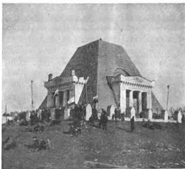
Памятникъ надъ братскою могилою русскихъ воиновъ, убитыхъ при взятіи Казани.

По окончаніи молитвы всѣ воеводы и начальники начали приносить поздравленія великому государю на Богомъ дарованномъ царствѣ Казанскомъ. Государь милостиво благодарилъ всѣхъ и подтвердилъ свое обѣщаніе жаловать своимъ великимъ жалованьемъ.