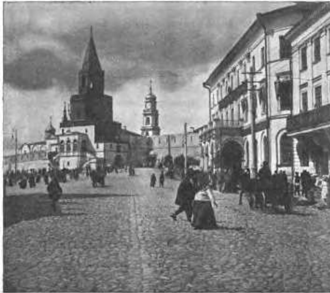
Спасская башня съ церковью Спаса Нерукотвореннаго.

дасть насъ въ руки врагамъ нашимъ. Не пощадите головъ своихъ за благочестіе, если умремъ, то не смерть это, а жизнь, если не теперь умремъ, то умремъ же послѣ, а отъ этихъ безбожныхъ какъ впередъ избавимся? Я съ вами самъ пришелъ: лучше мнѣ здѣсь умереть, нежели жить и видѣть за свои грѣхи Христа хулимаго и порученныхъ мнѣ отъ Бога христіанъ мучимыхъ отъ безбожныхъ казанцевъ! Если милосердный Богъ милость свою вамъ пошлетъ, подастъ помощь, то я радъ васъ жаловать великимъ жалованьемъ, а кому слу-