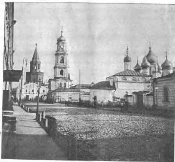
Спасскій монастырь въ Кремлѣ и церковь Свв. Кириіана и Іустинна.

„Приспѣло время нашему подвигу: потщитесь единодушно пострадать за благочестіе, за святые церкви, за православныхъ