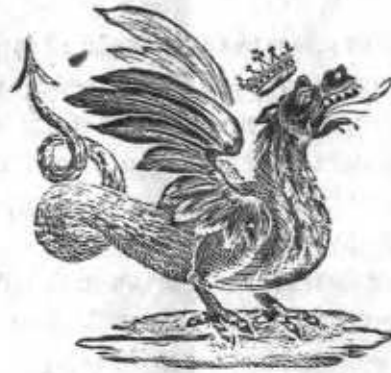
Гербъ Казани—змѣй Зилантъ.

В олѣе тысячи лѣтъ тому назадъ, когда еще только начинало складываться Русское государство, на самой окраинѣ тогдашней Русской земли—на Камѣ-рѣкѣ и Средней Волгѣ—было большое и богатое царство—по прозванью—царство Булгарское. Главный городъ этого царства—столица Булгарь—находился въ предѣлахъ нынѣшняго Спасскаго уѣзда Казанской губерніи. Немногочисленные остатки этого города можно видѣть еще и теперь въ 10 верстахъ отъ берега Волги, близъ Спасскаго затона. Кромѣ этого города, были въ Булгарскомъ царствѣ и другіе большіе города, какъ напримѣръ, Билярскъ, Жукотинъ, около нынѣшняго Чистополя, но отъ нихъ ничего уже не осталось до нашего времени.