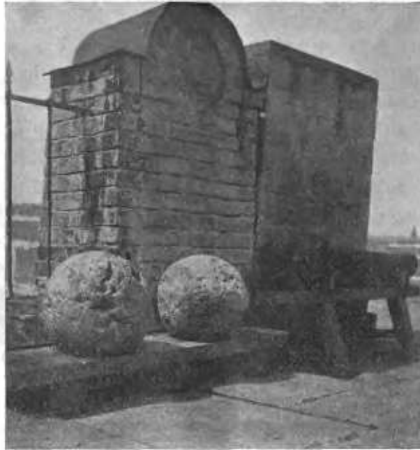
Каменные ядра, и чугуныя пушки, сохранившіеся въ Казани со времени ея покоренія.

Ружьями-самопалами-рушницами были вооружены, почти, только одни стрельцы. Были въ войскѣ и конные люди, были и