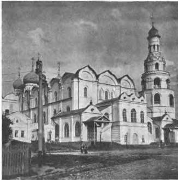
Благовѣщенскій Каѳедральный соборъ въ Казани.

храмъ во имя Спаса Нерукотвореннаго и неподалеку отъ этого мѣста другой храмъ въ честь Свв. Кипріяна и Иустины, память которыхъ празднуется 2-го октября — въ день взятія Казани. Затѣмъ государь приказалъ освободить всѣхъ русскихъ плѣн-