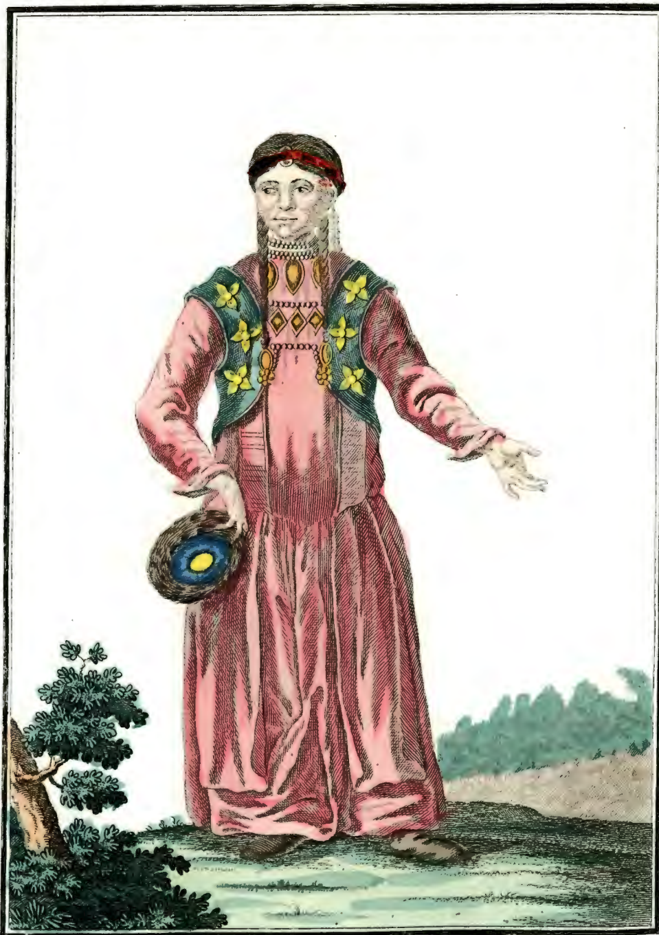
Брацкѣя баба въ удинскомѣ Острогѣ съ лица. Ein Bratzkisches Weib zu Udinskoi Ostrog vorwärts. Femme Bratsquienne à Udinskoi Ostrog par devant.