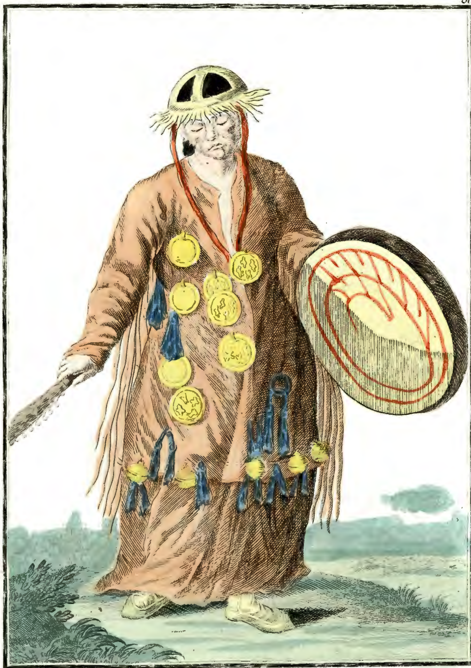
Монгольскаѣ Шаманка. Eine Mongalische Schamanka od. Watusagerin. Chamane ou J. évineresse Mongale.