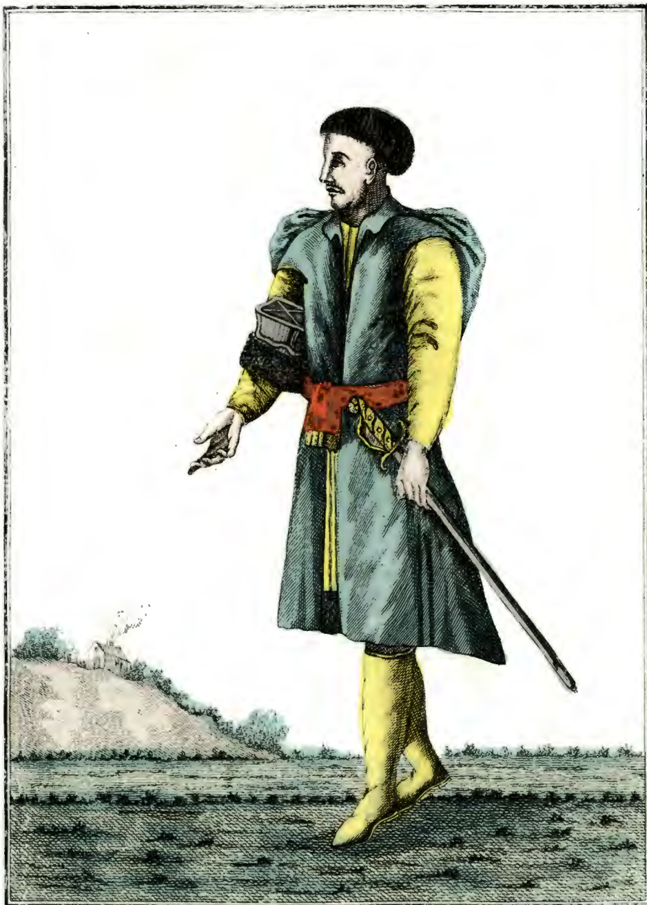
Полякъ. Ein Polack. Un Polonois.