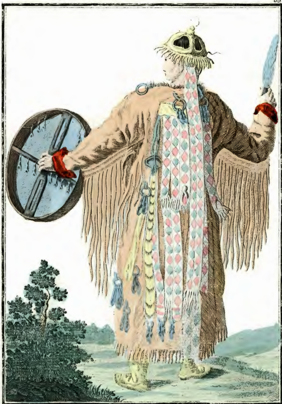
Брацкая Шаманка со спины. Eine Bratzkische Schamanka rückwärts. Chamaïne Bratsquienne par derriere.