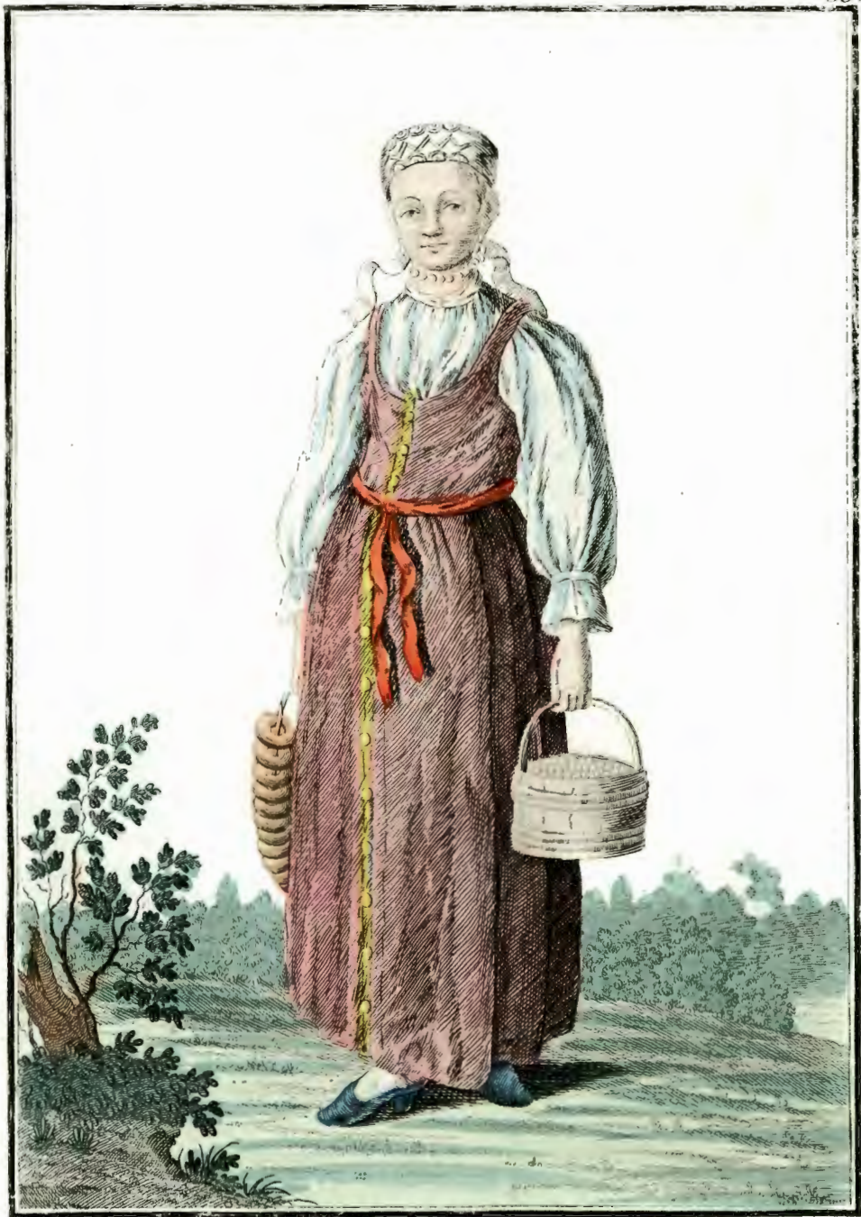
Валдинская Дѣвка. Ein Waldaiſch - Mägdgen. Une Fille de Waldai.