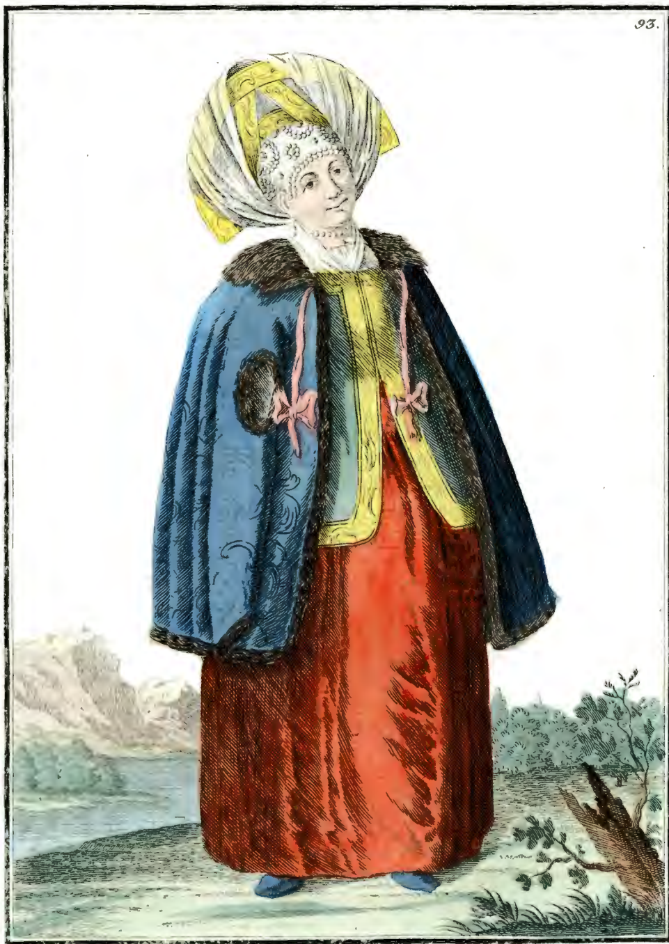
Калу́жская женщина въ зимней платьѣ. Eine Kaluzgische Frau im Winterkleide. Une Femme de Kalouga en habit d'hiver.