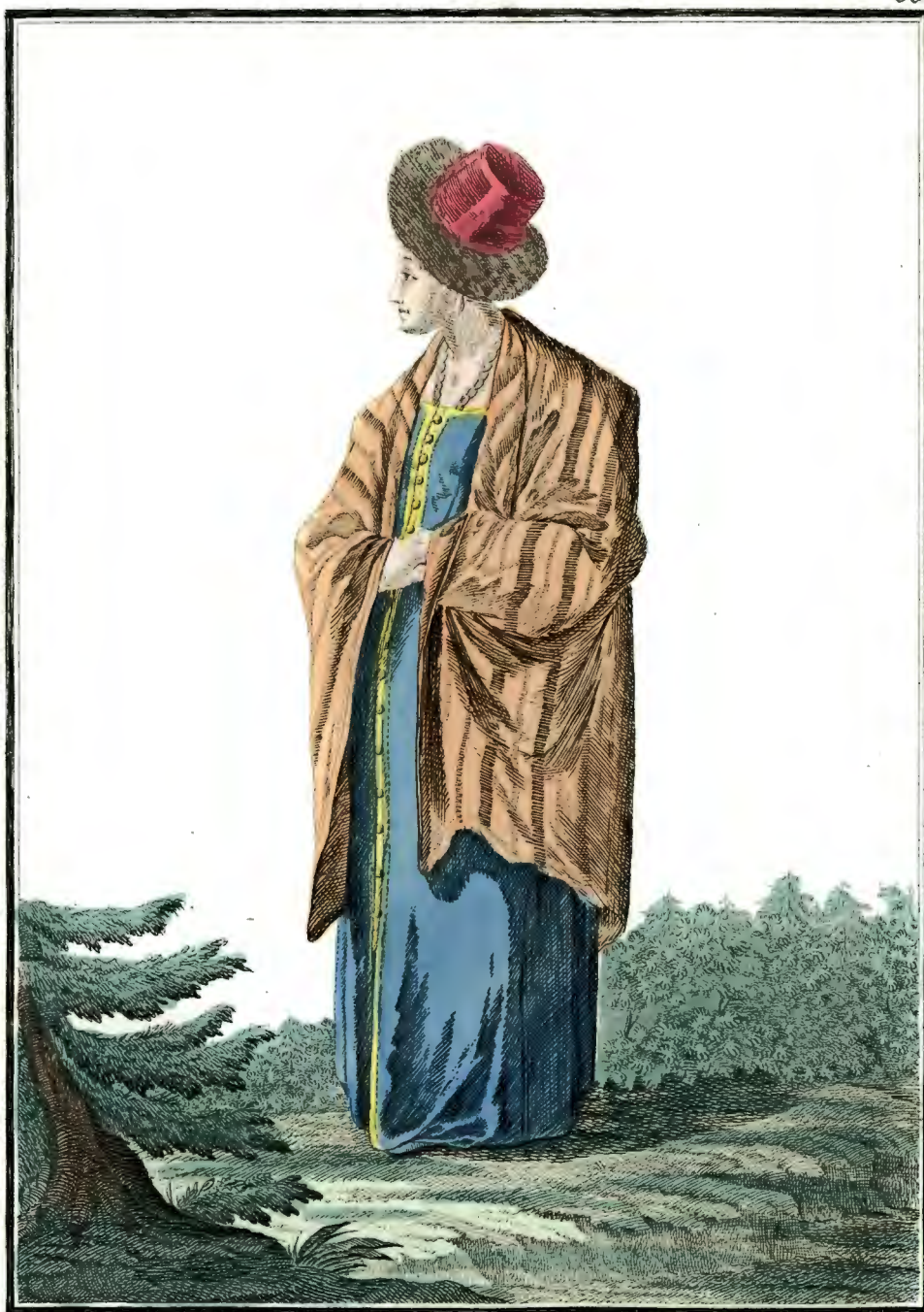
Валдайская баба. Ein Waldaijsches Weib. Femme de Waldaij.