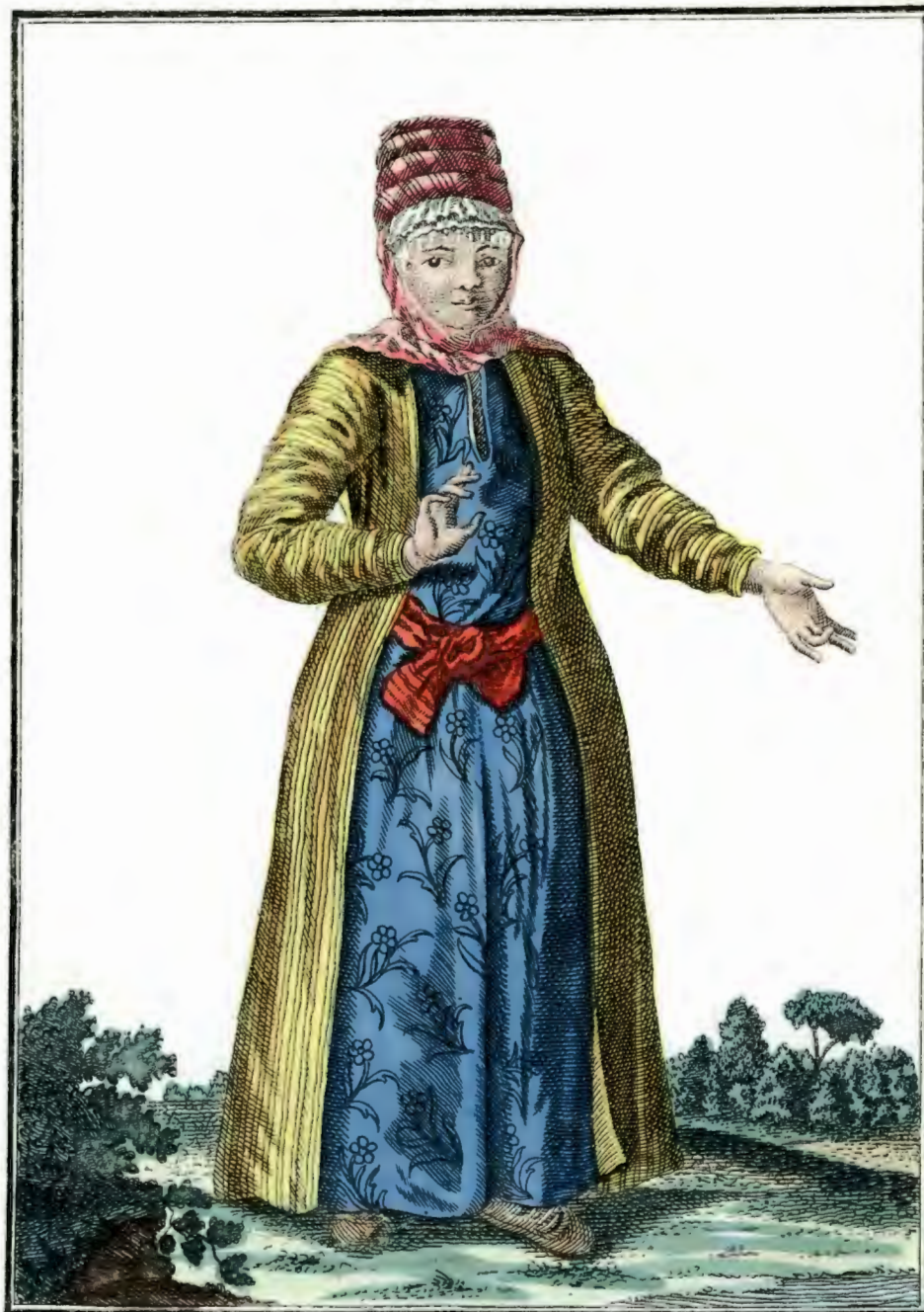
Киргиска съ лица. Eine Kirgisin vorwärts. Une Kirgisiene par devant.