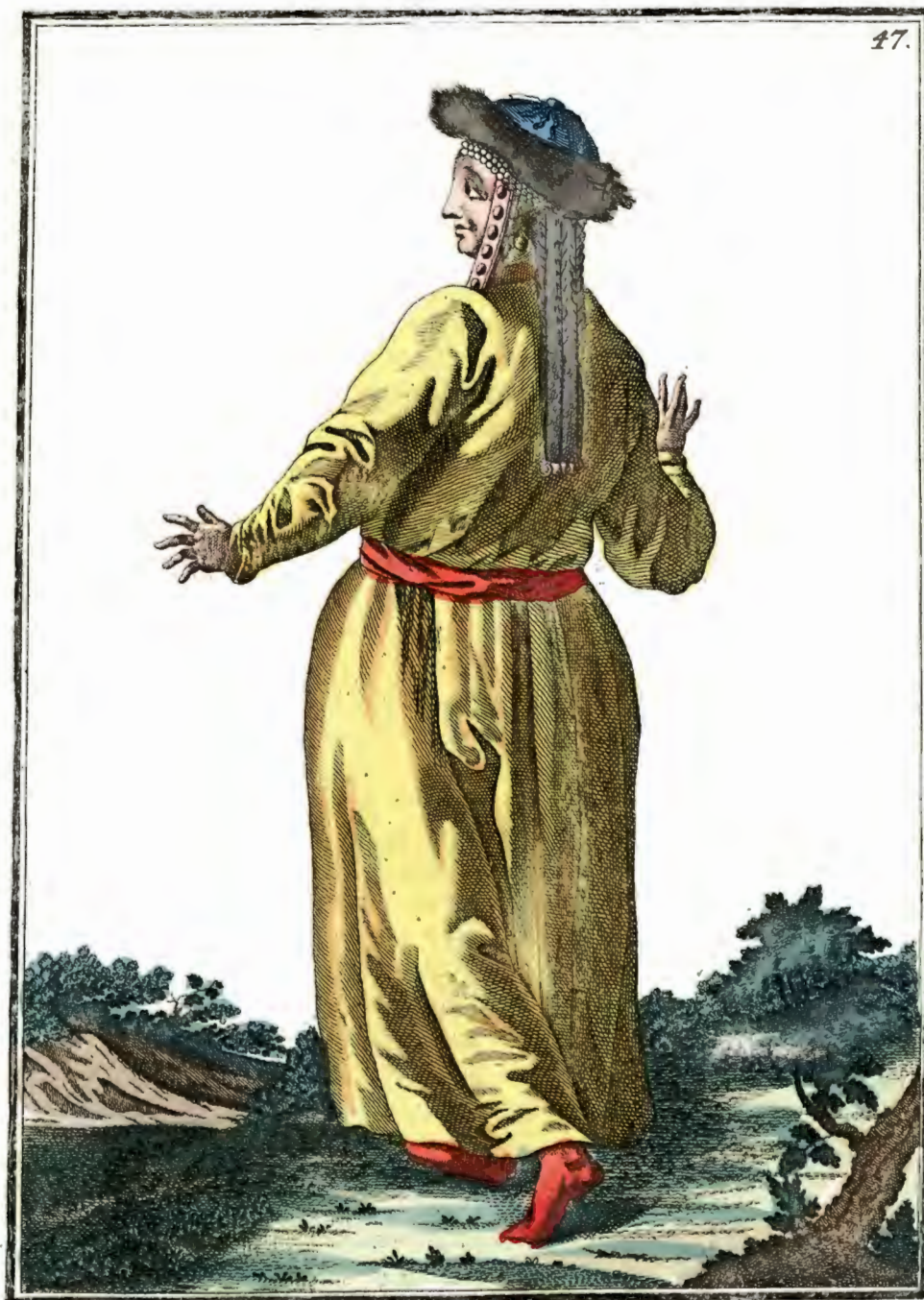
Татарская баба въ Кузнецкѣ съ пыла Ein Tatarisches Weib zu Kousnetz k rückwärts Femme tatare à Kousnetz k par derrière