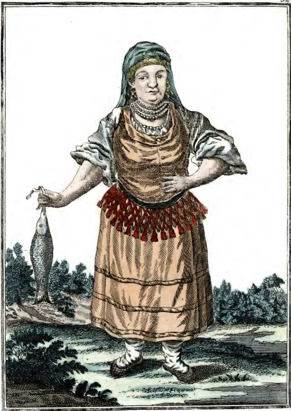
Кабардинка Eine Kabardinerin. Une Kabardinienne.