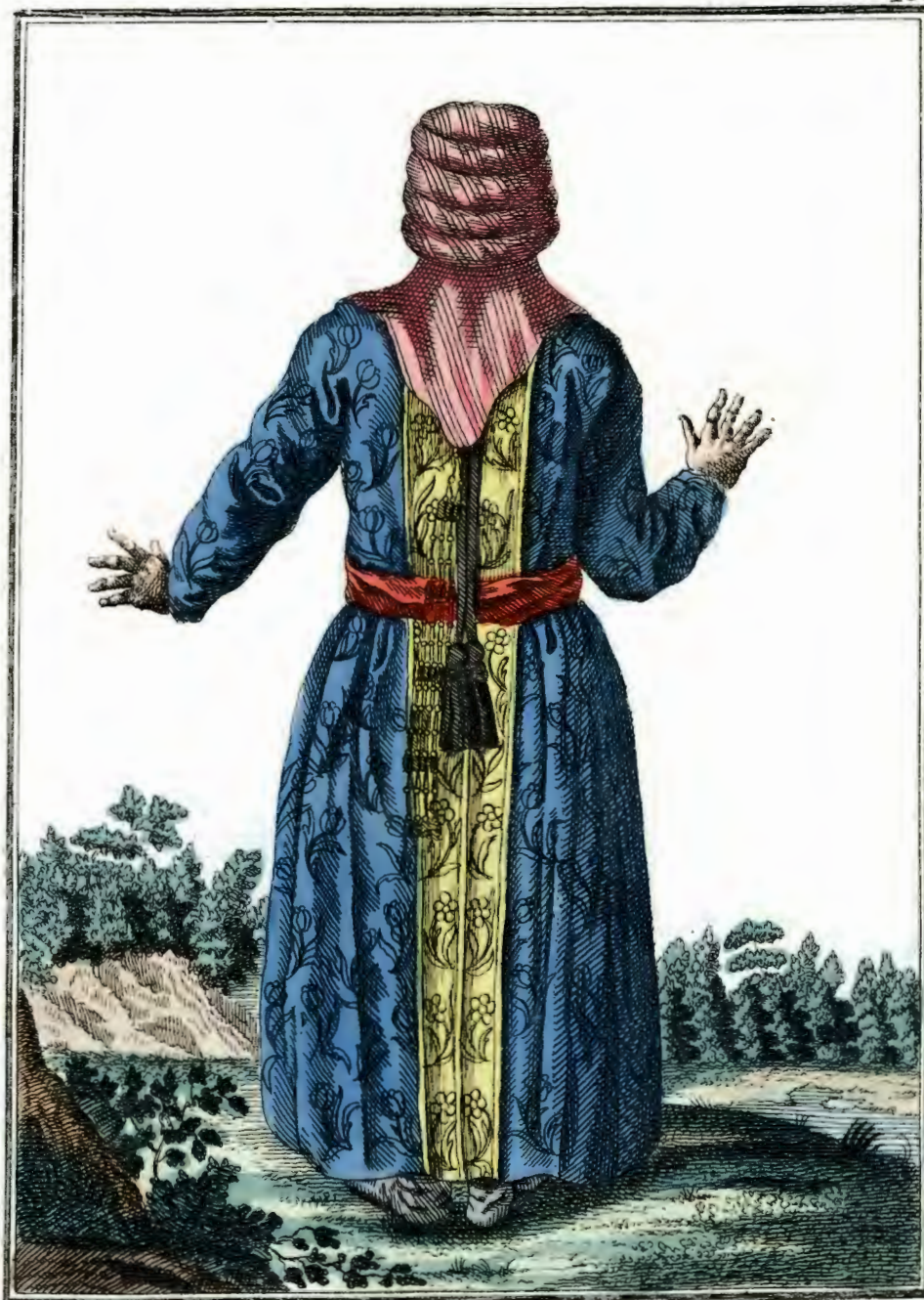
Kirgizna съ пыла. Eine Kirgizin rückwärts. Une Kirgisiene par derriere.