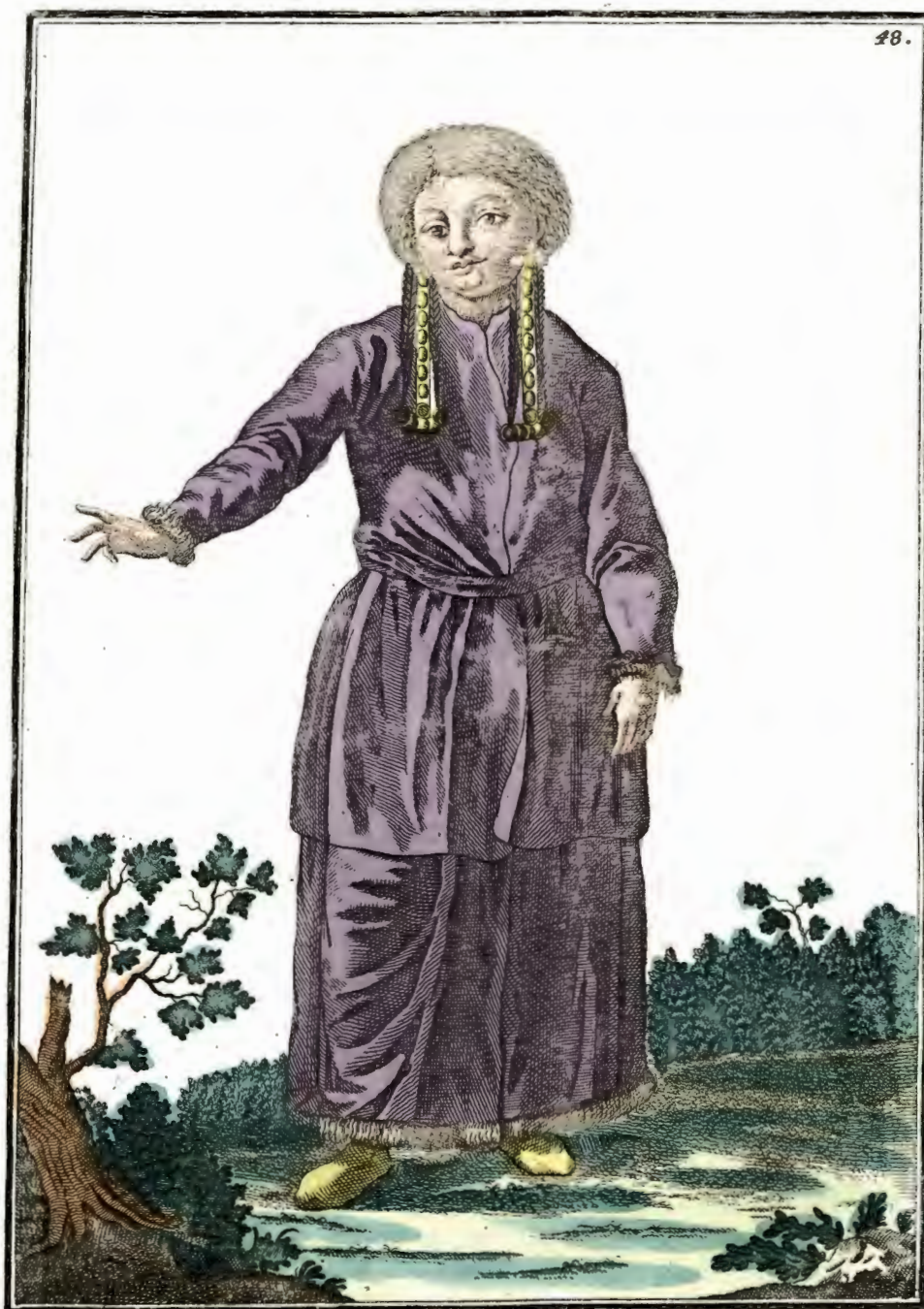
Татарская девушка въ Кузнецкѣ съ лица . Ein Tatarisch Mäddgen zu Kusnetzck vorwarts . Fille tataric à Kouznetok par devant .