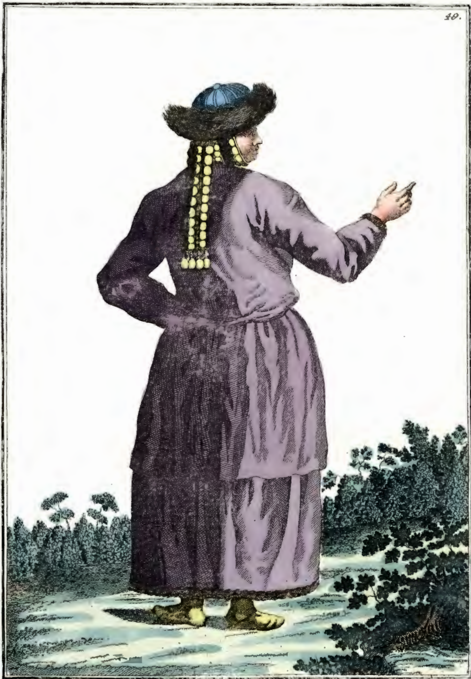
Татарская Девушка съ Кознецкѣ со спины. Ein Tatarisch Mädchen zu Kusnetzsk rückwärts. Fille tataric Kouznetsk par derriere.