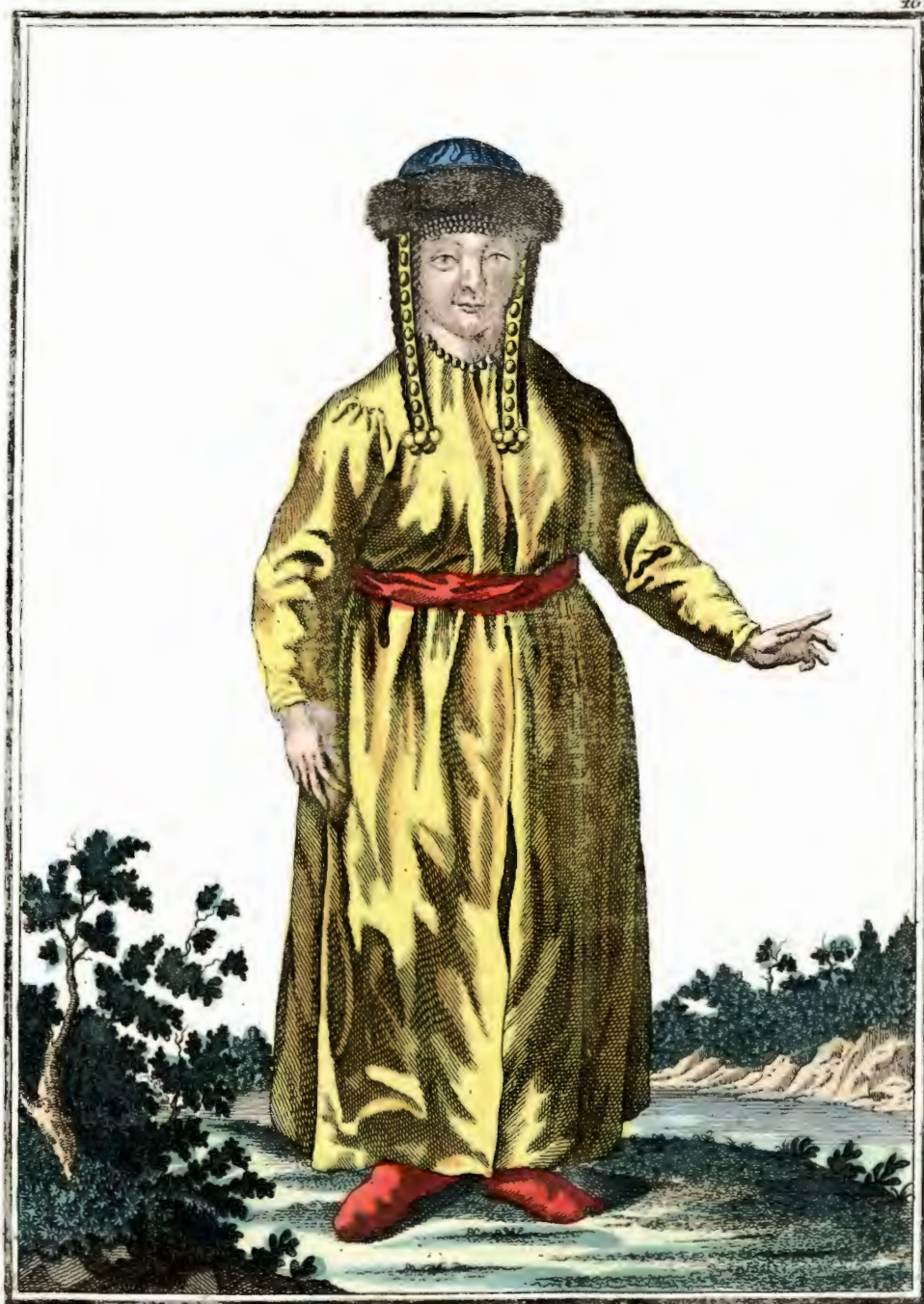
Матарская баба въ Кузнецкѣ съ лица. Ein Tatarisches Weib zu Kusnetzck vorwärts Feme tartare à Kouznetzk par devant.