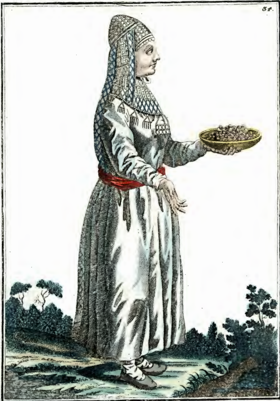
Tankupka Eine Baschkirin. Une Baskirienne.