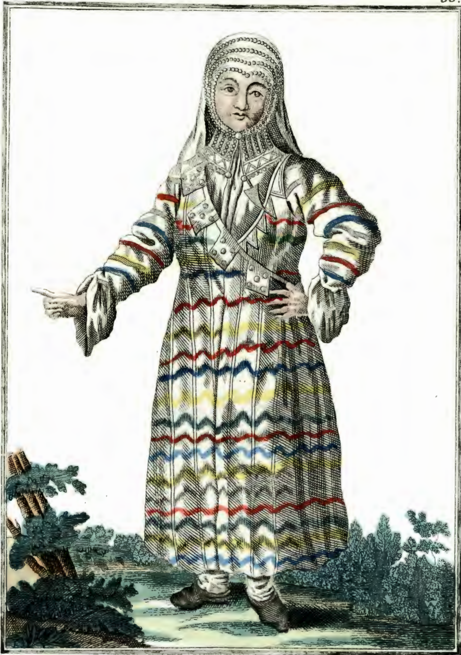
Метерялка. Eine Metschenikin. Une Metcherèke.