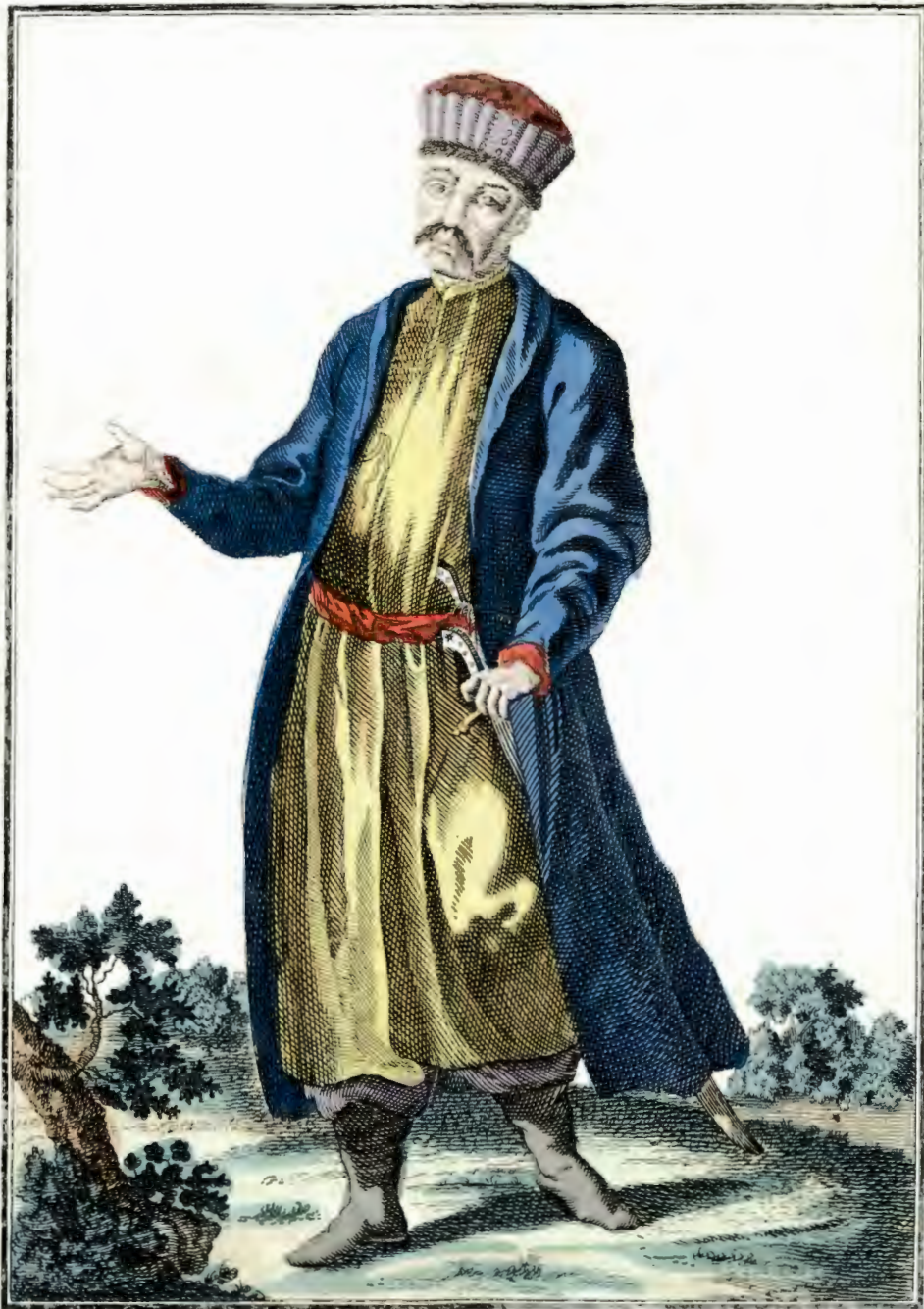
Кабардинецъ. Ein Kabardiner: Urn Kabardinien