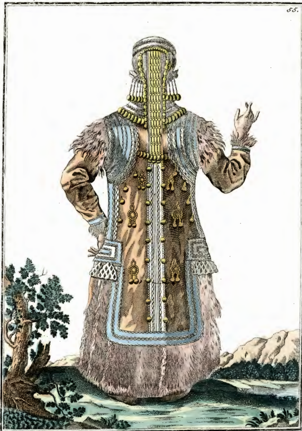
Якутская дѣвка со спиною. Ein Jakutisches Mägdgen rückwärts. Fille Jakoute par derrière.