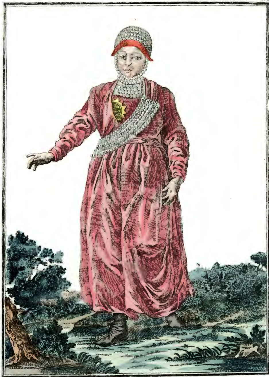
Татарка Казанская спереди. Eine Kasansische Tatarin vorwärts. Femme Tattare de Casan par devant.