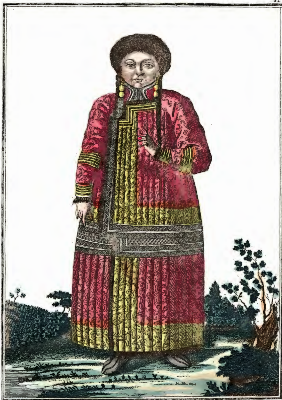
Качинская татарская баба . Ein Katschinskisches Tataren Weib . Femme tatare de Katchin .