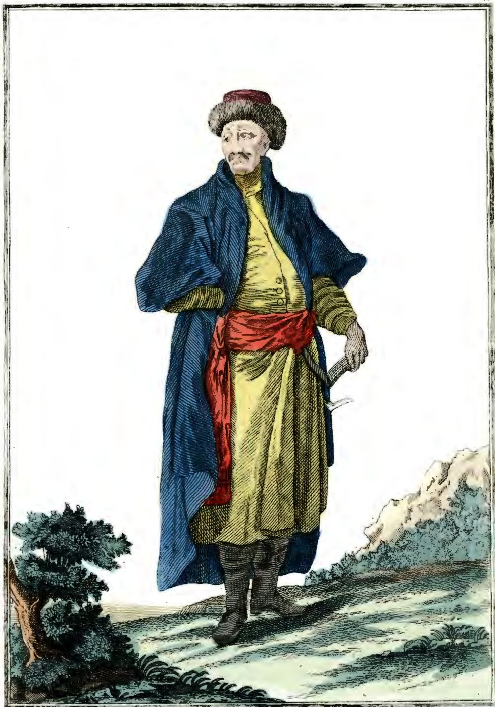
Казанской Татаринъ . Ein Kasanischer Tatar . Tattare de Kasan .