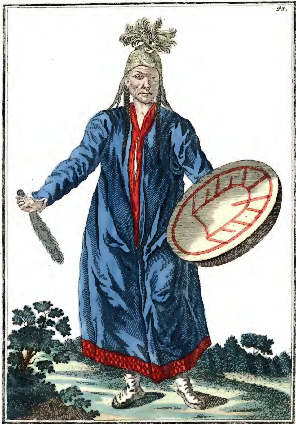
Шаманка въ красноярскомъ ѣздѣ. Une Schamanka im Krasnojarskischen District Une Chamanne ou Devineresse du district de Krasnojarsk.