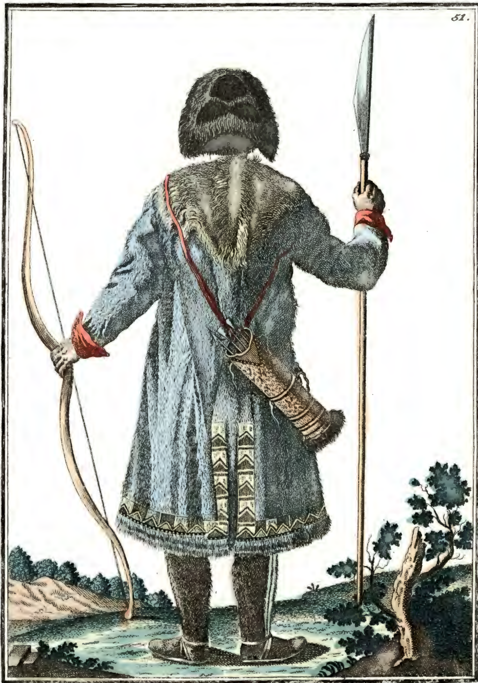
Якутъ нь охочьбамъ платьемъ сзади . Ein Jakut im Jagd Kleid von hinten . Un Jakout en habit de chasse par derrière .