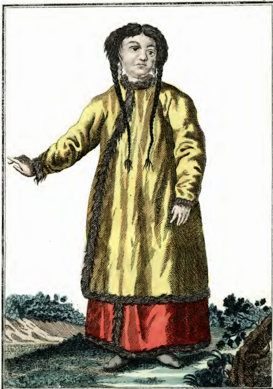
Барабинская баба. Eine Barabinzische Frau. Femme Barabinzoise.