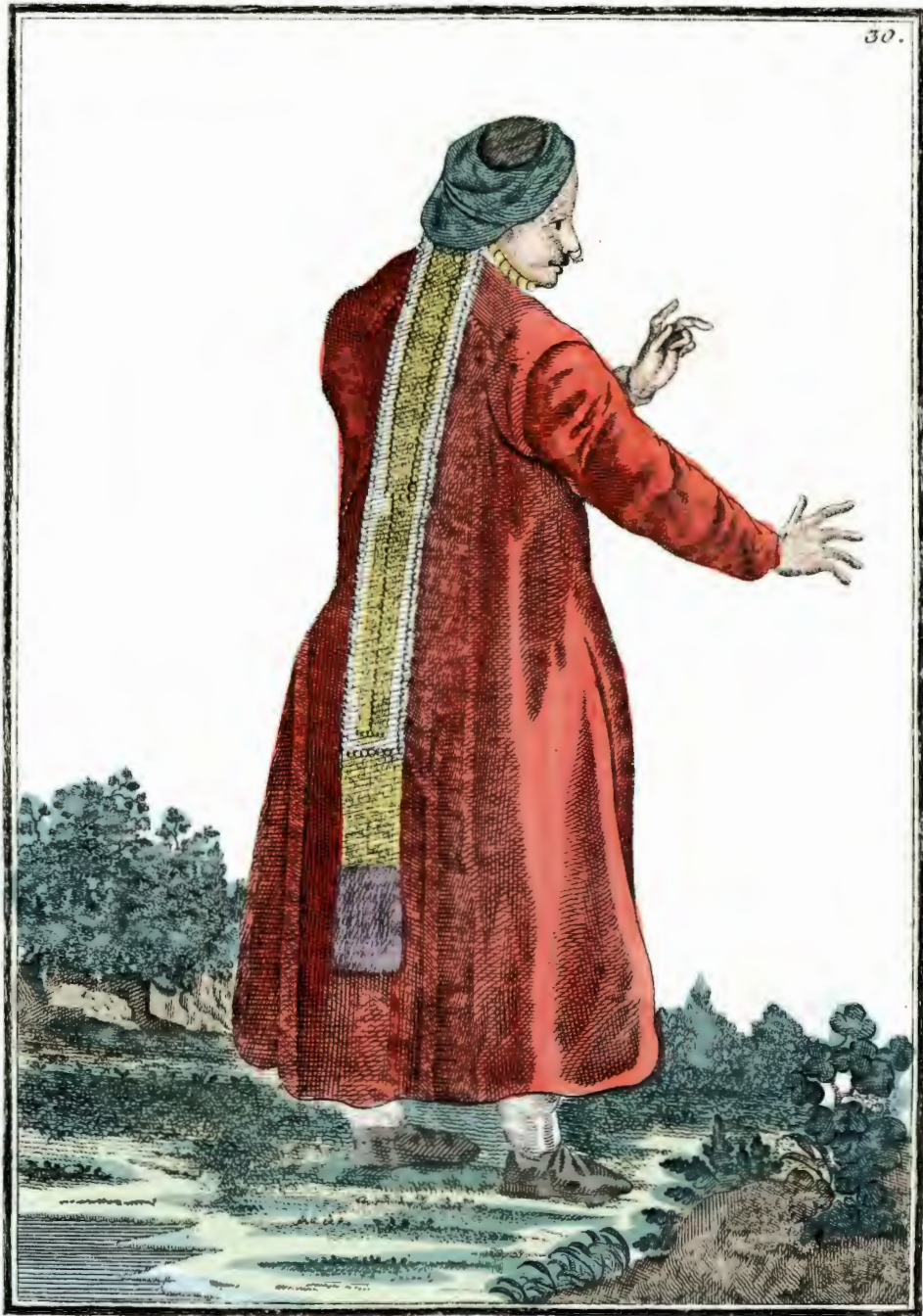
Ногайская патарка . Eine Nogaische Tatarin . Femme de Tatares Nogais .