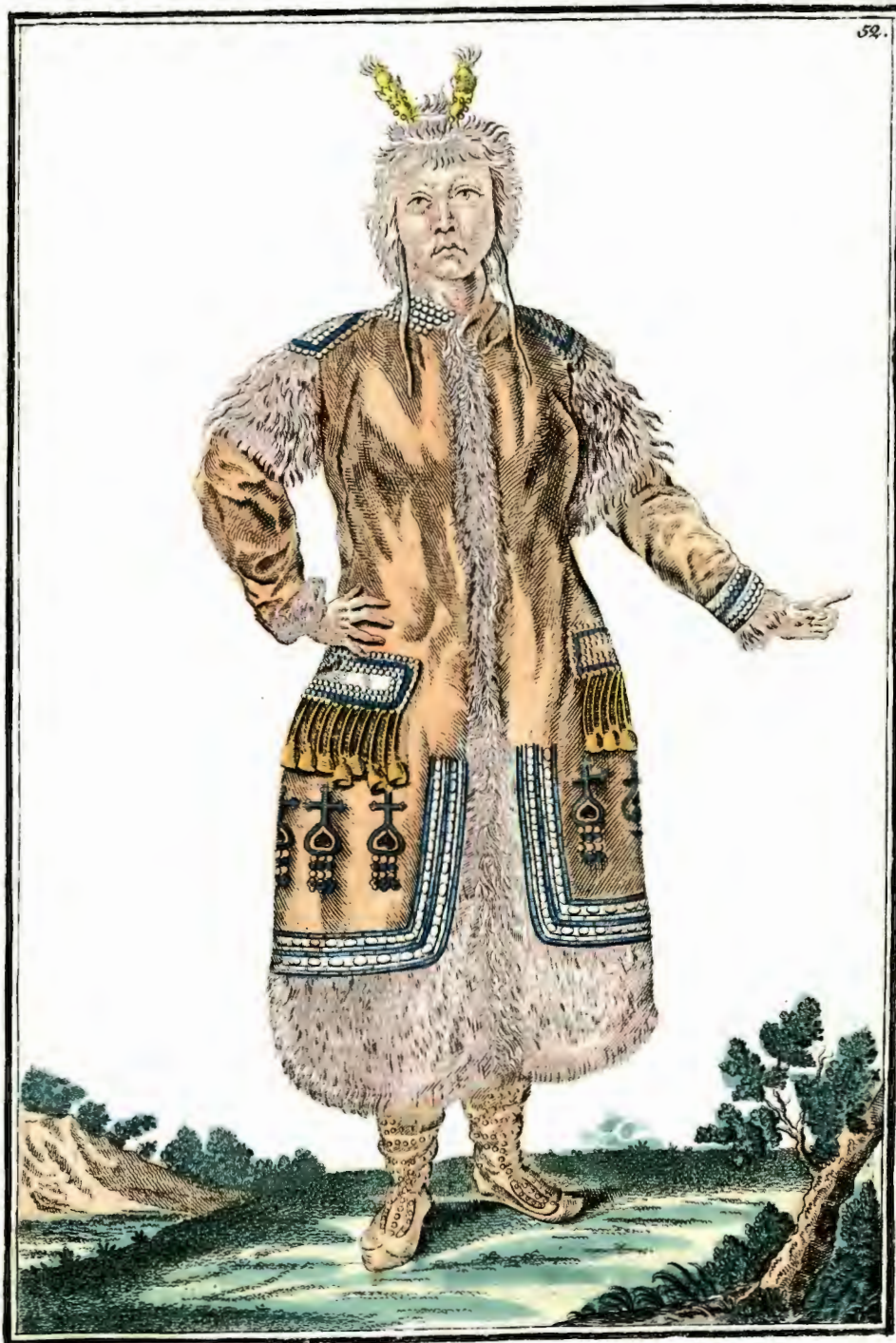
Якутская баба спереди. Eine Tschakutin vorwärts. Femme Tschakoutie par devant.