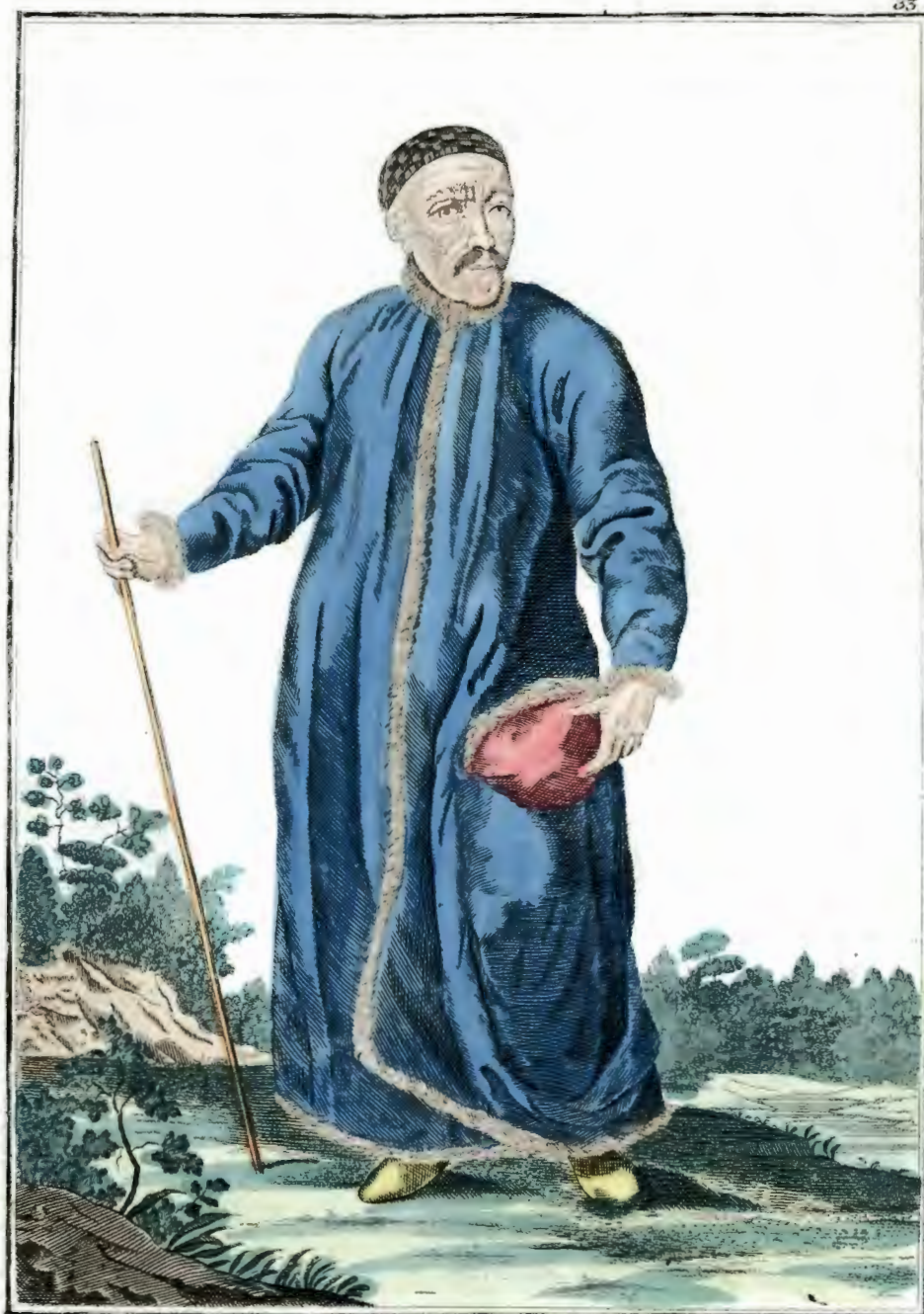
Сибирской Бухаръ . Ein Sibirischer Buchar . Un Buchar de Siberie .