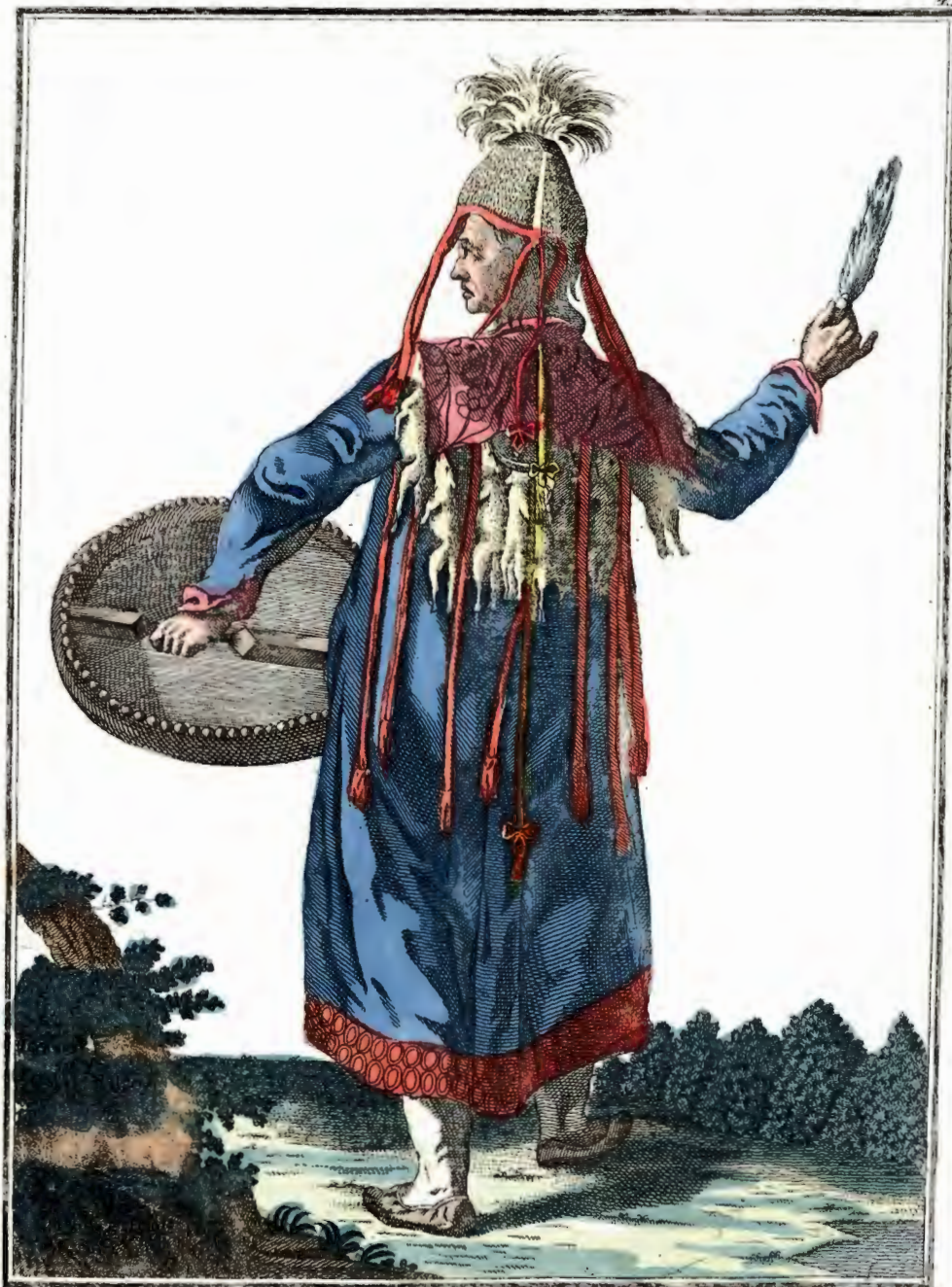
Шаманка красноярская съ тыла . Eine Krasnojarskische Schamanka rückwärts . Une Chamane ou Devineresse de Krasnojarsk par derrière.