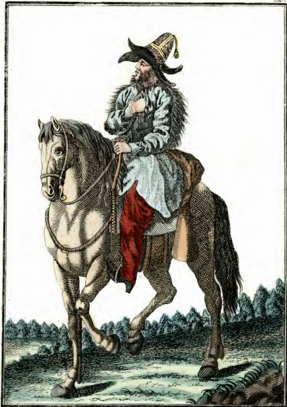
Киргизецъ на конѣ. Ein Kirgise zu Pferde. Kirgise à cheval.