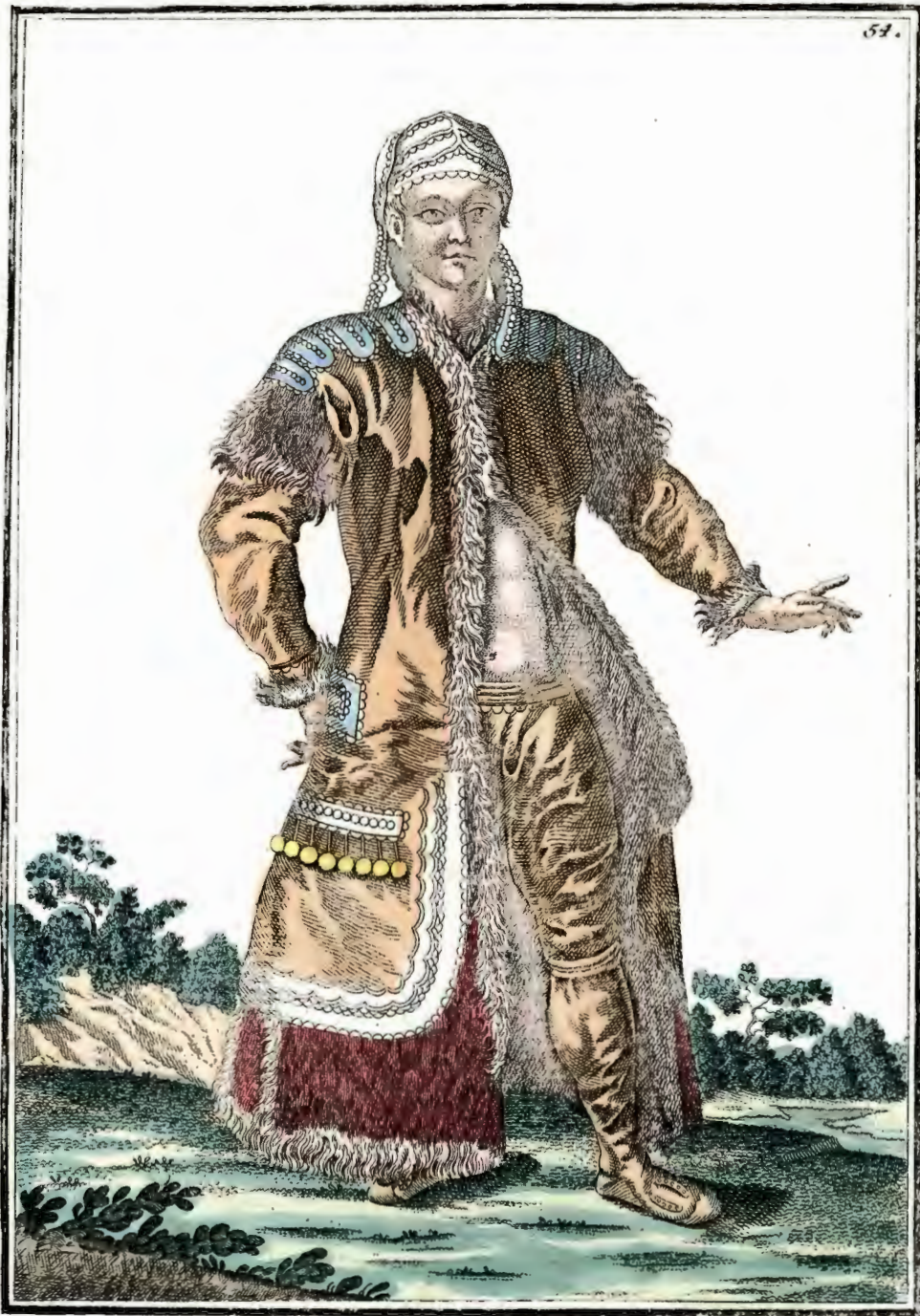
Якутская дѣвка съ лица. Ein Jakulisches Mägdgen vorwärts. Fille Jakoute par devant.