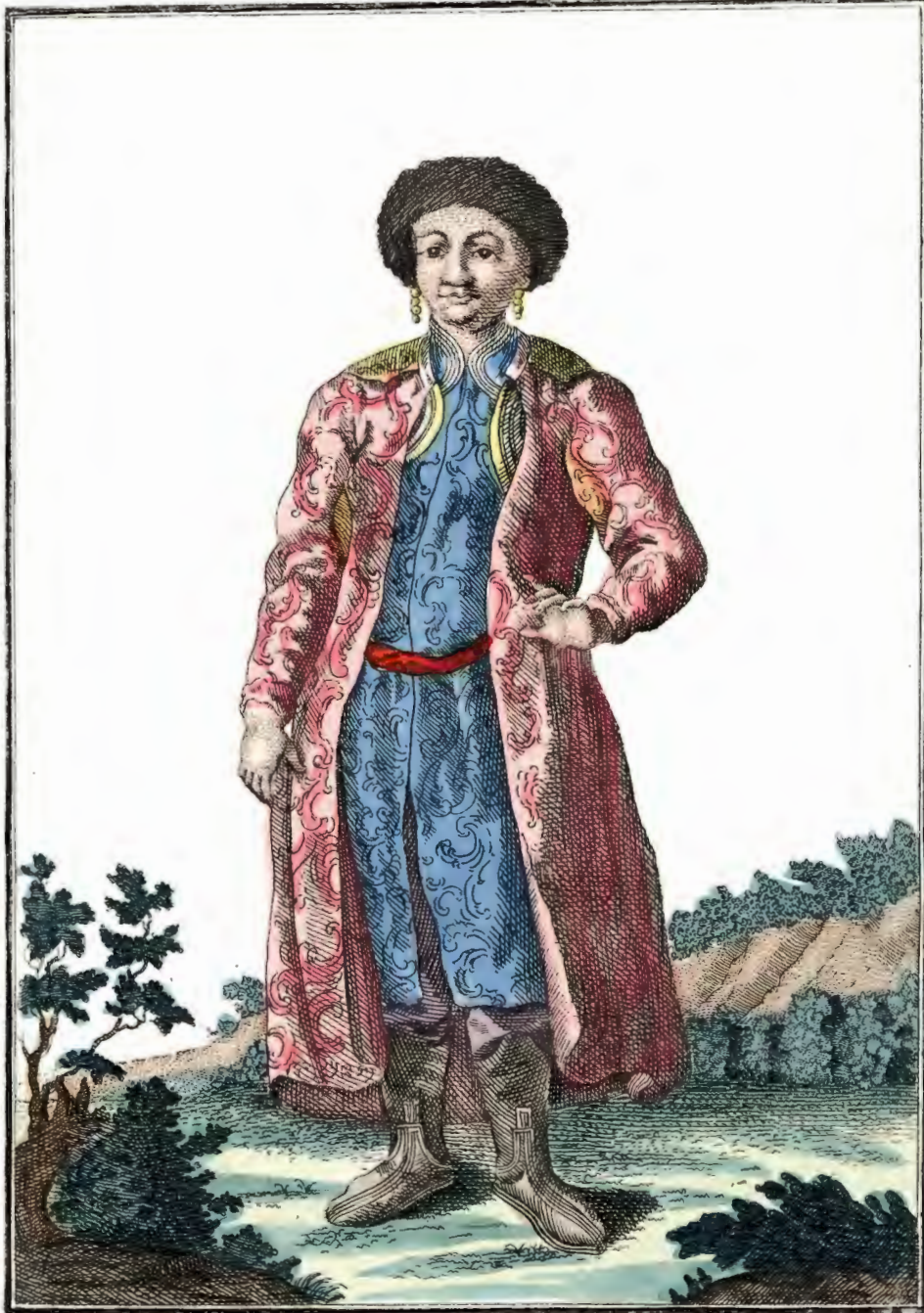
Катчинская дѣвушка съ лица. Ein Katschinskisches Mägdgen vorwärts. Fille tatare de Katchin par devant.