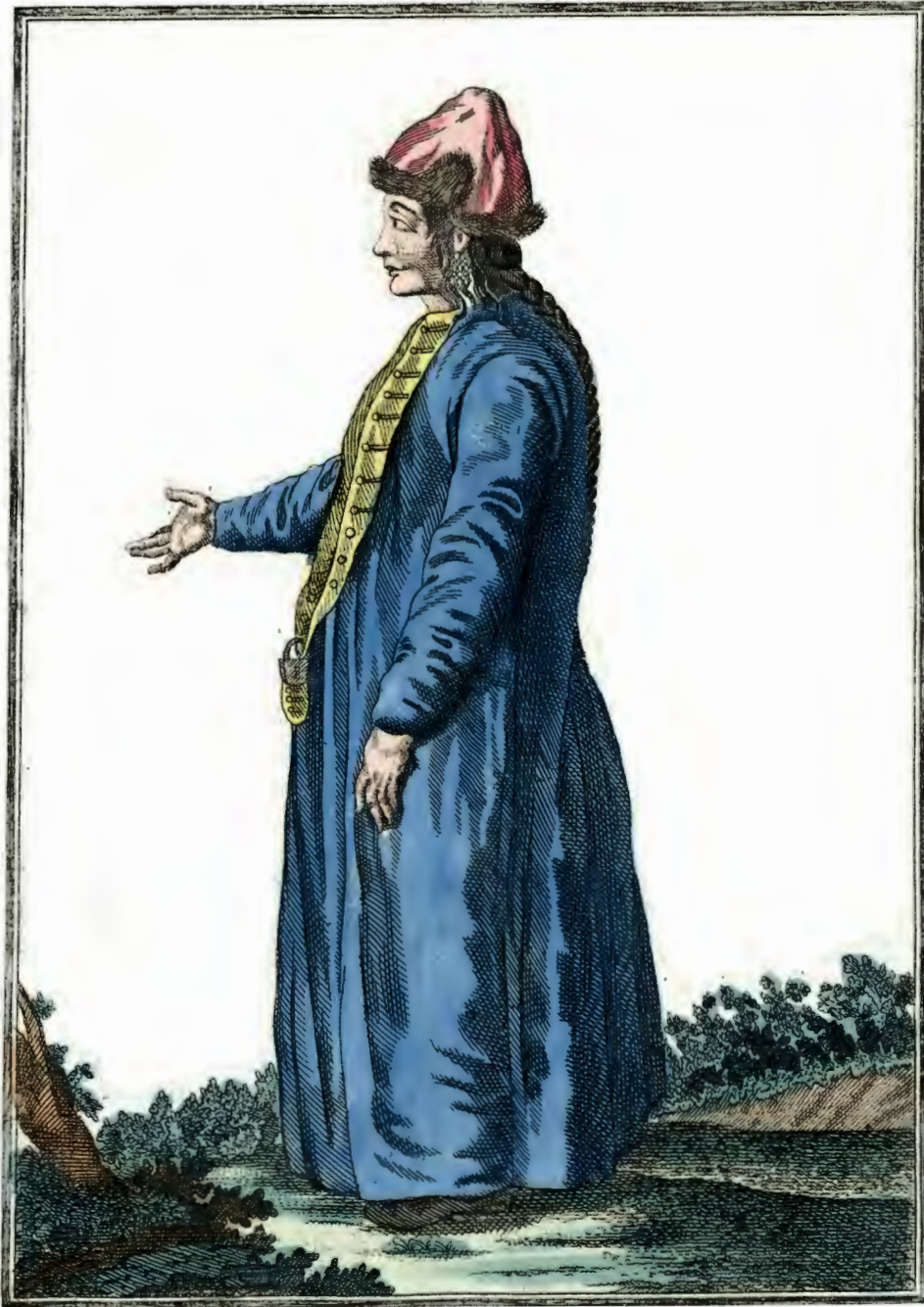
Барабинская дѣвка . Ein Barabinzisch Mädden . Fille Barabinzoise .