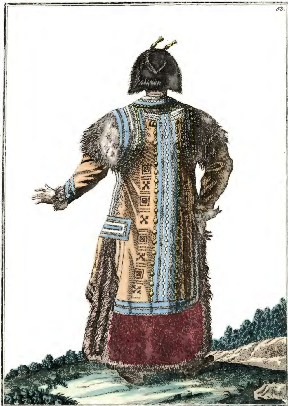
Якутская баба сзади. Eine Tackutin rückwärts. Feme Tackoute par derriere :