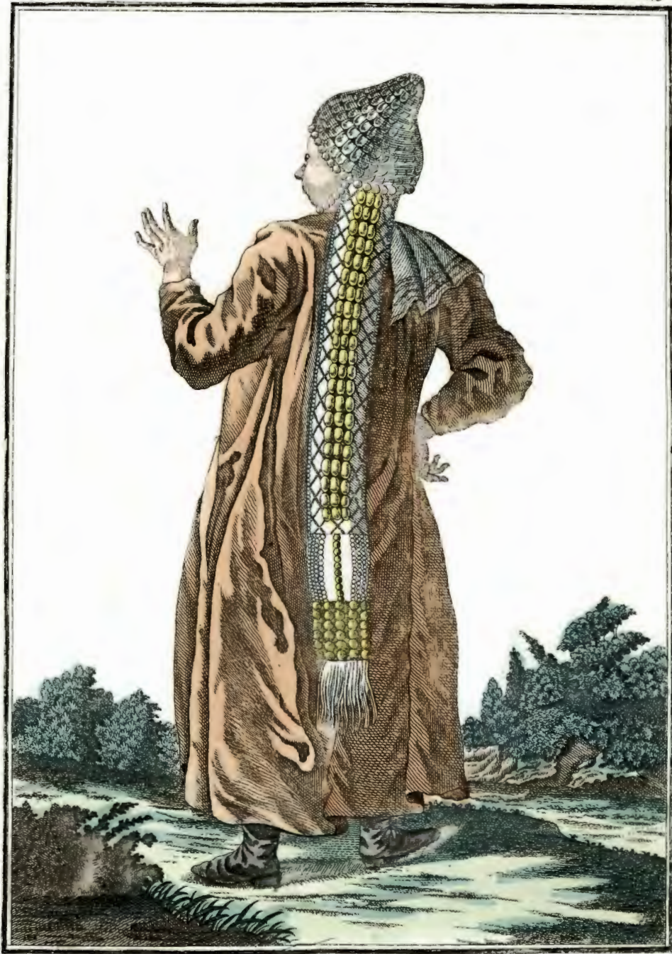
Татарка казанская сзади. Eine Kasanische Tatarin rückwärts. Femme Tattare de Casan par derrière.