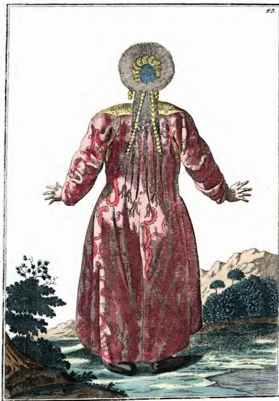
Катчинская дѣвушка съ тыла . Ein Katschinskisches Mägdgen rückwärts . Fille tatarre de Katchin par derriere .