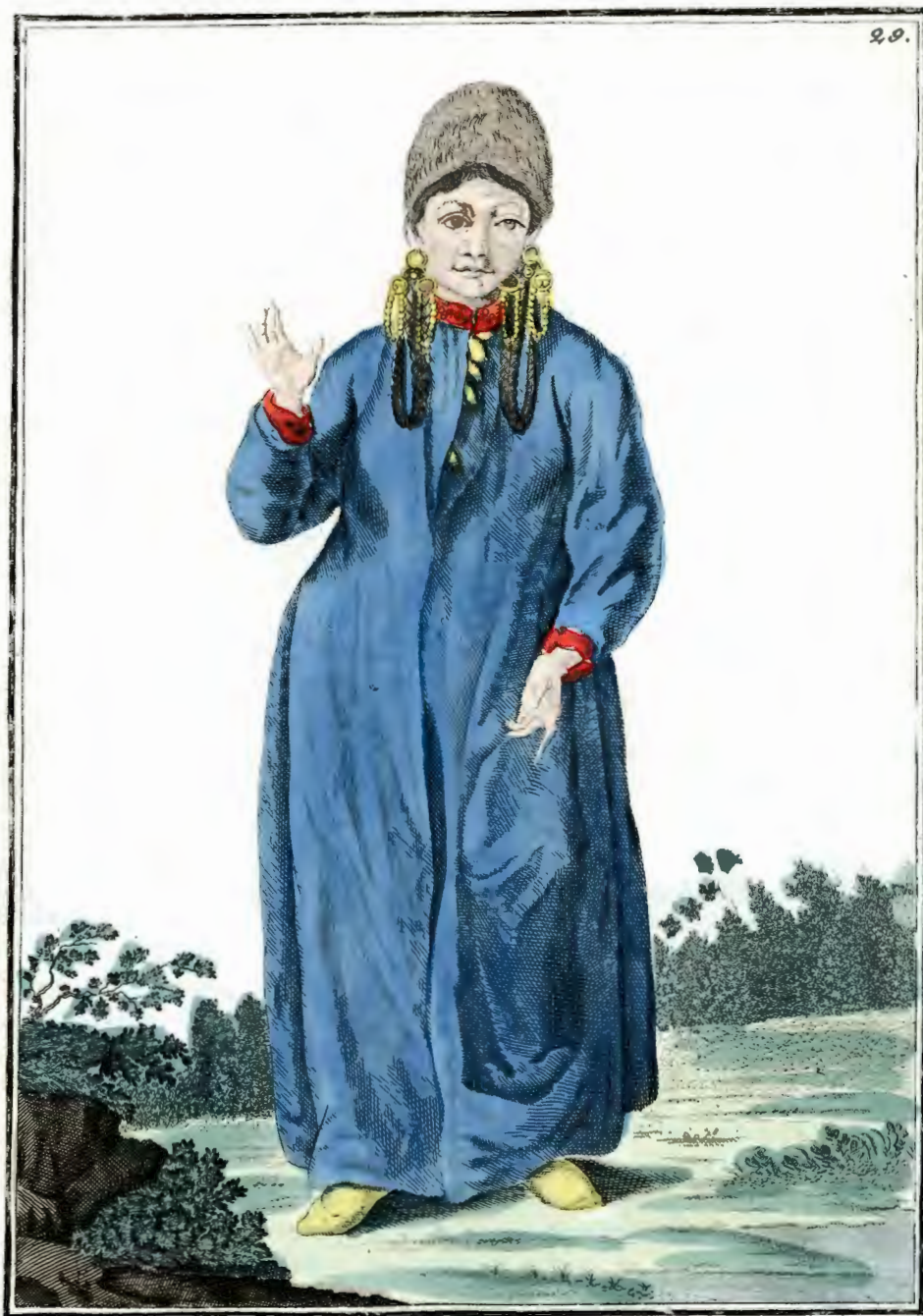
Чатская татарка . Eine Tschatskische Tatarin . Femme tatare de Tschatsk .