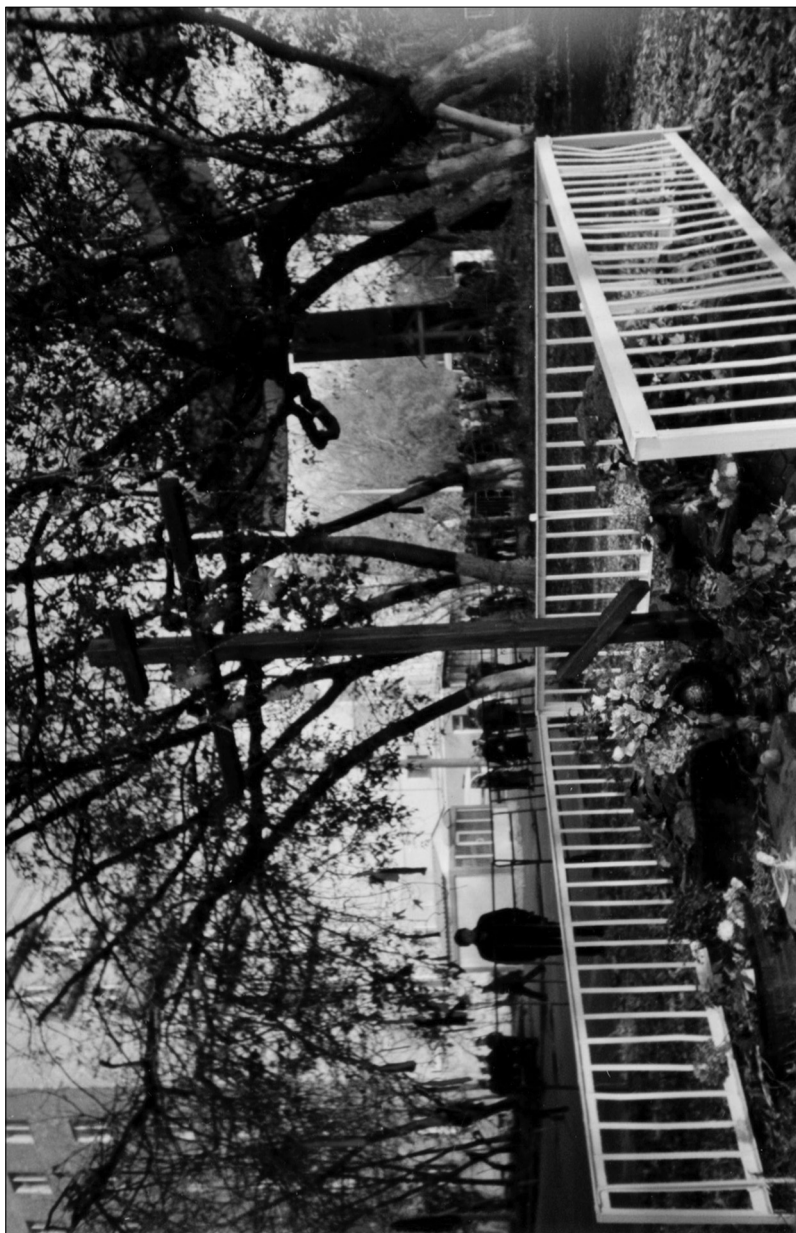
Могилы расстрелянных у Дома Советов 4 октября 1993 года.