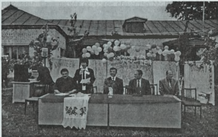
Хоршевашской школе в 2006 году исполнилось 120 лет.

жайшего учреждения и суда создавались в волости. Были об-