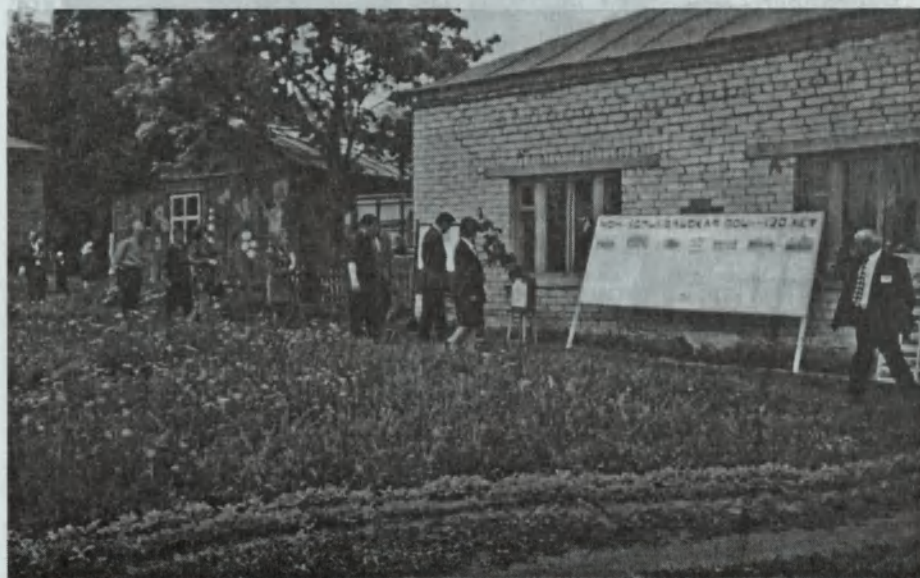
Хоршевашцы отмечают юбилей своей школы, вспоминают лучшие годы.