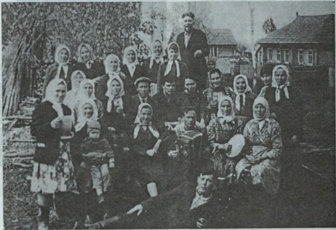
Хоршеващцы празднуют Троицу. В начале 20-го века здесь проводилась Троицкая ярмарка.