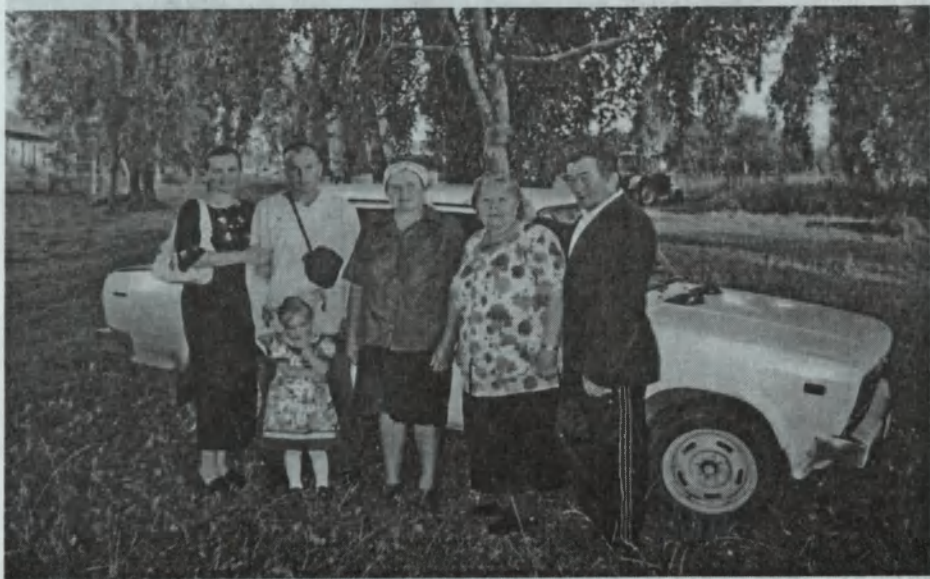
Семья Якимовых из рода Савоськи. Савось — не от чувашского «савас» ли?