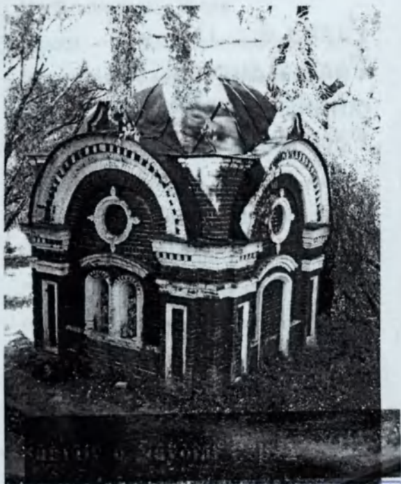
Часовня у Святого Ключа

Коль жить достойно хочешь ты, Трудись на благо Родины!