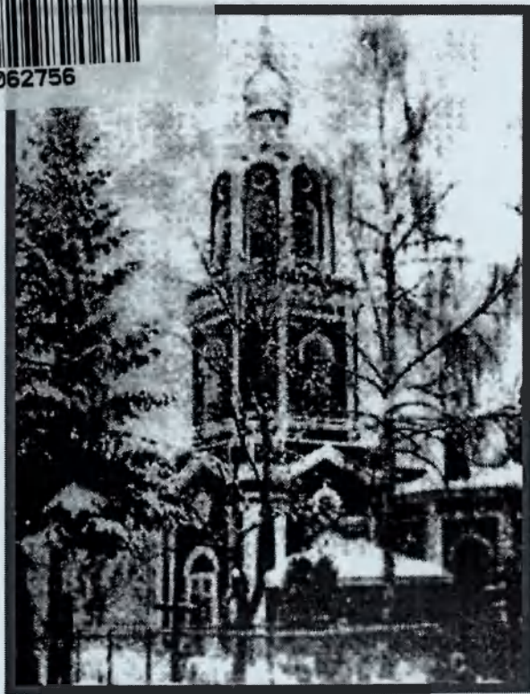
Церковь Успения Пресвятой Богородицы (ныне не существует).