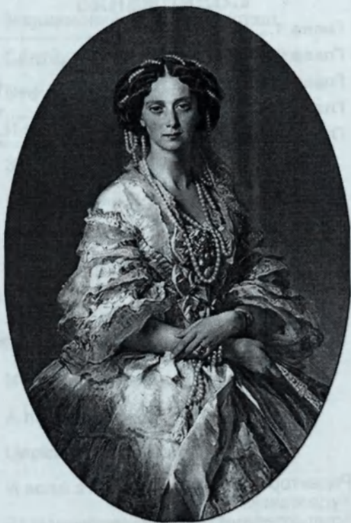
Императрица Мария Александровна.