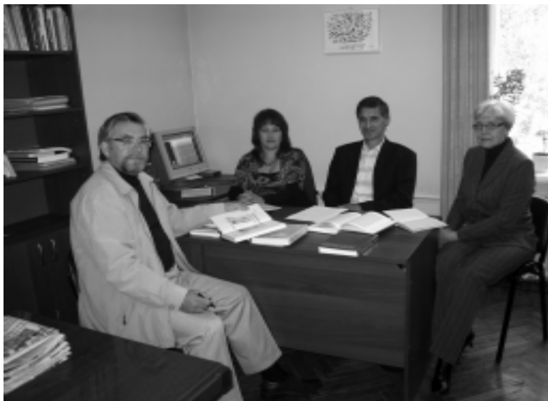
В отделе этнологии и антропологии. 2010 г.