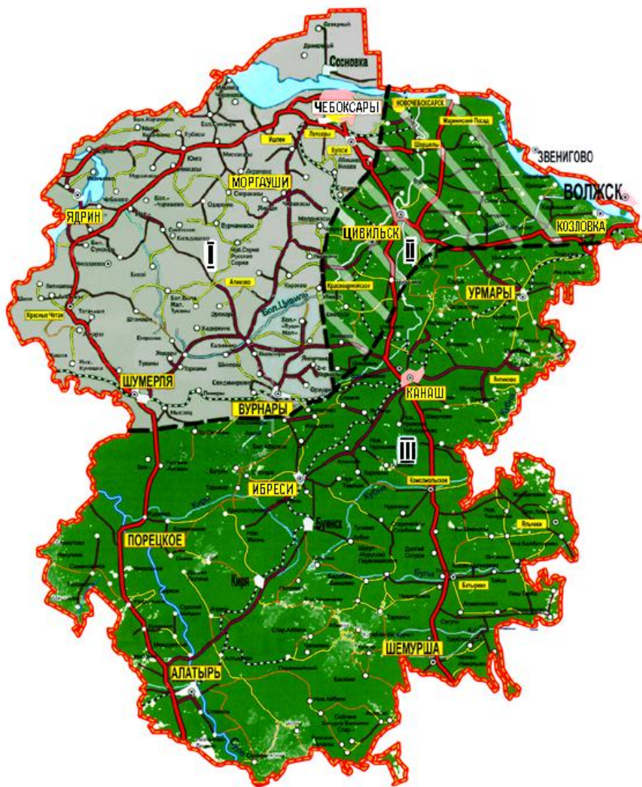
ЧУВАШИ: I – верховые, II – средненизовые, III – низовые