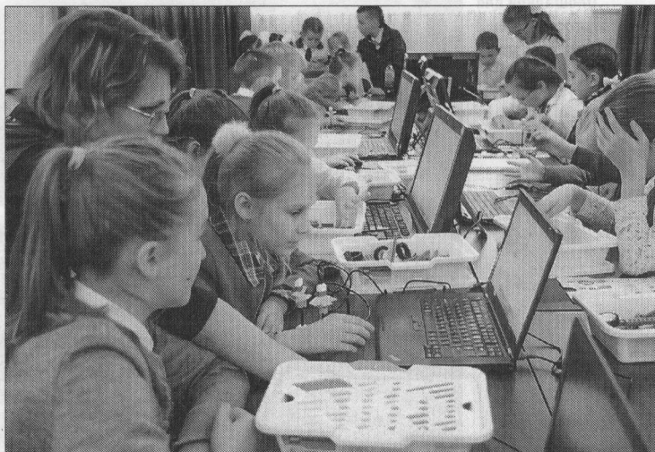
▲ Помимо изучения традиционных дисциплин – химии, биологии, физики, астрономии – ребята на протяжении Года науки и технологий будут активно пробовать себя в изобретательстве

С 2019-го по 2021 г. от региона было подано 26 заявок, шесть из которых прошли конкурсный отбор. На 2022 г. планируется подать ещё шесть. Как проектный офис НБ осуществляет методическое сопровождение создания и развития модельных учреждений – с оказания помощи в подготов-