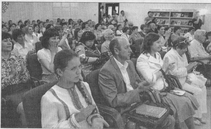
▲ В рамках конференции, посвящённой состоянию и популяризации чувашского языка, собрались учёные, педагоги, писатели и другие эксперты. Благодаря трансляции за обсуждением следили более двух тысяч человек