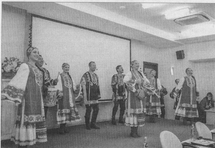
▲ В повестке дня форума не только деловые встречи, но и самобытная культурная программа