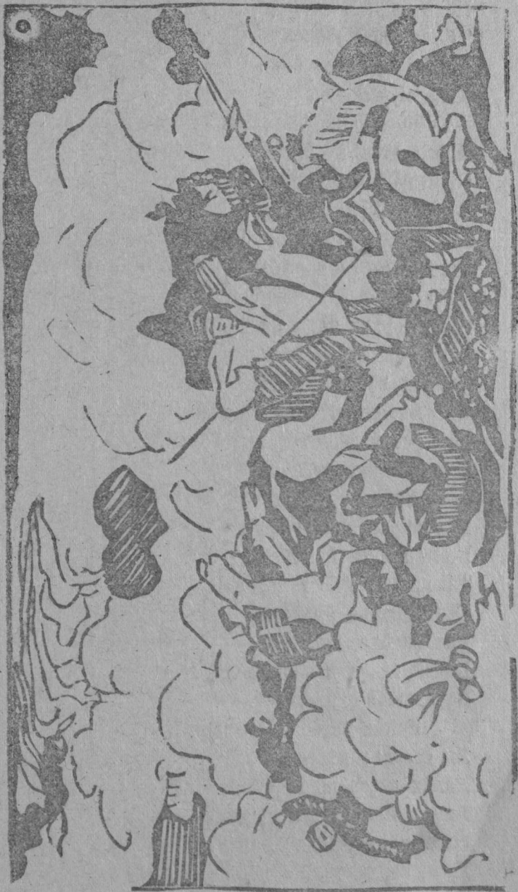
Видны танцы жезел сур.