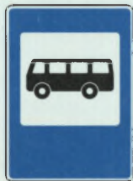
ՄԵՏՈ ՕՏԱՆՈՎԿԻ ԱՎՏՈՅՍԱ Ի ՏՐՈԼԼԵՅՅՍԱ ԱՎՏՈՅՍ, ՏՐՈԼԼԵՅՅՍ ՇԱՐՈՆՄԱԼԼԻ ՎՐՈՆ