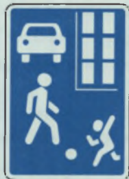
ЖИЛАЯ ЗОНА ПУРАНМАЛЛИ СУРТ-ЙЁР ВYРАНЁ