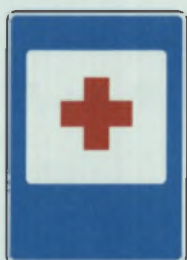
ПУНКТ ПЕРВОЙ МЕДИЦИНСКОЙ ПОМОЩИ ВАСКАВЛӘ МЕДИЦИНА ПУЛӘШӘВЕН ПУНКЧЁ