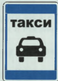
МЕСТО СТОЯНКИ ТАКСИ ТАКСИ ТАМАЛЛИ ВYРАН