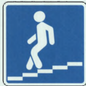
ՓՈԴՅԵՄՆՅ ՔԵՏԵՔՈԴՆՅ ՔԵՐԵՔՈԴ ՏԵՐ ԱՅԵՔԵ ԱՏՏԱ ԿԱՏՄԱԼԼԻ ՏՍԼ