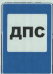
ПОСТ ДОРОЖНО- ПАТРУЛЬНОЙ СЛУЖБЫ СУЛ-ЙЁР ПАТРУЛЬ СЛУЖБИН ПОСЧЁ