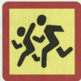
ՔԵՐՎՈՅԿԱ ԴԵՏԵՅ ՔԵՇԵԿ ԱՇԱՏԵՆԵ ԻԼՏԵ ՏՍՐԵՏՏԵ