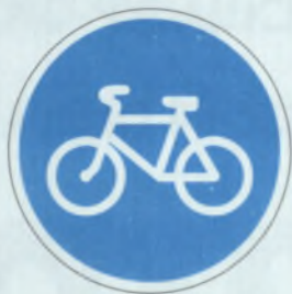
ВЕЛОСИПЕДНАЯ ДОРОЖКА ВЕЛОСИПЕДПА ЂЎРЕМЕЛЛИ ЂУЛ