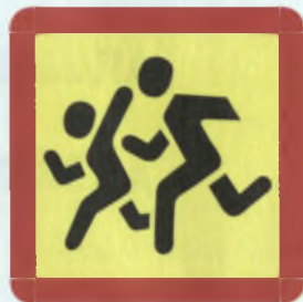
ПЕРЕВОЗКА ДЕТЕЙ ПЁЂЁК АЂАСЕНЕ ИЛСЕ ЂЎРЕЂЁ