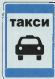
МЕСТО СТОЯНКИ ТАКСИ ТАКСИ ТЀМАЛЛИ ВYРЀН