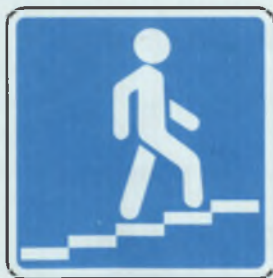
НАДЗЕМНЫЙ ПЕШЕХОДНЫЙ ПЕРЕХОД ЂЁР СИЁПЕ УТСА КАЂМАЛЛИ ЂУЛ