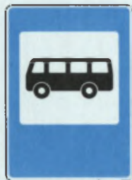
МЕСТО ОСТАНОВКИ АВТОБУСА И ТРОЛЛЕЙБУСА АВТОБУС, ТРОЛЛЕЙБУС ЂАРЃНМАЛЛИ ВЪРЃН