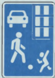
ЖИЛАЯ ЗОНА ПУРАНМАЛЛИ СУРТ-ЙЁР ВYРАНЁ