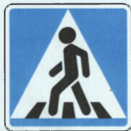
ПЕШЕХОДНАЯ ДОРОЖКА ЂУРАН ЂЎРЕМЕЛЛИ ЂУЛ