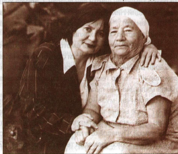
Амәшәпе. 2001 җ.