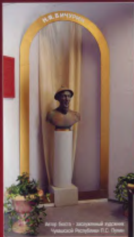
Меню Биста - заслуженный художник Чувашской Республики П.Д. Пуши