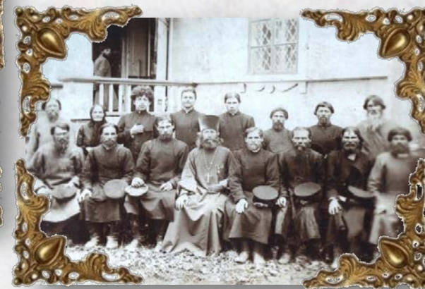
Служители храма 1912 год.