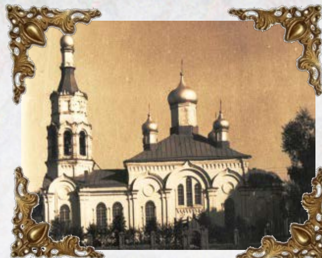
Храм Рождества Христова в 1950-1960 годах