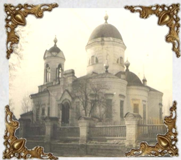
Храм в 1941-1945 годы