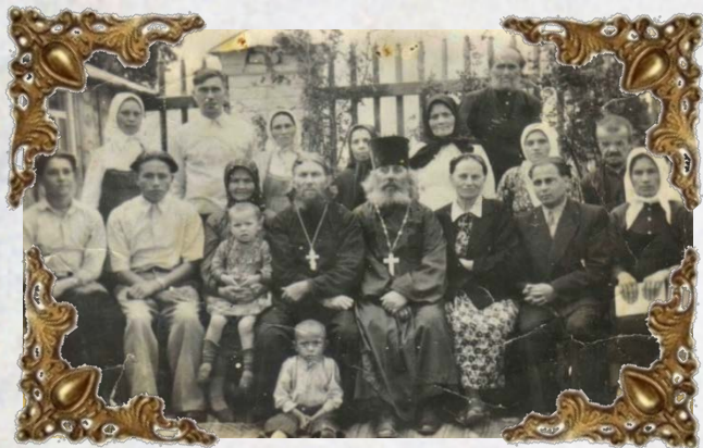
Прихожане Анат-Кинярской церкви