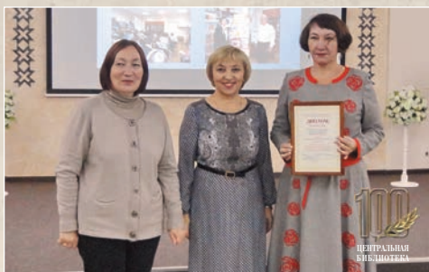
Мы – лауреаты!