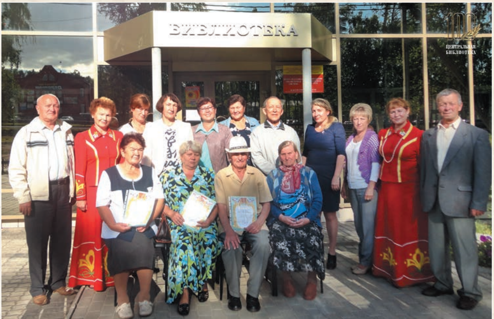
Ветераны культуры района (2015 г.)

Ежегодно МБУ «ЦБС» Чебоксарского района принимает активное участие в проектах разного уровня. В 2015 году за реализацию проекта «Литературная карта Чебоксарского района» библиотека стала лауреатом V Республиканского смотра-конкурса в номинации «Центральная районная библиотека» и призером V этапа Всероссийского смотра-конкурса электронной продукции служб информации по культуре и искусству.