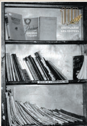
Так начиналась библиотека (1920-е годы)