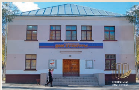
С 1962 по 1980 год библиотека располагалась в здании районного Дома культуры