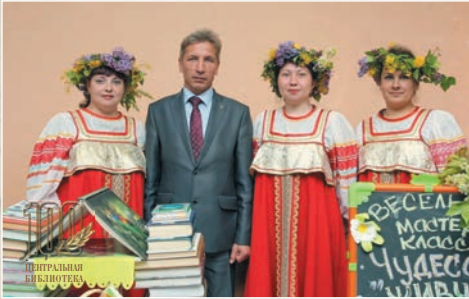
На выставке книг, посвященной Дню защиты детей (2017 г.)