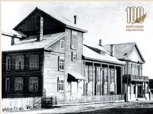
В этом здании библиотека находилась с 1935 по 1961 г.