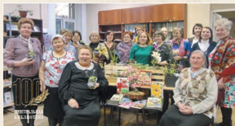
Члены клуба «Пурнаç сүлĕ» (2017 г.)