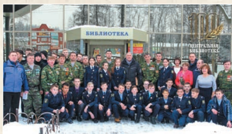
Фотография на память в День защитников Отечества, 2017 г. (вверху справа)