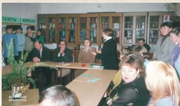
Открытие модельной библиотеки (2003 г.)

7 апреля 2003 года Президент Чувашии Н.В. Федоров подписал указ «О создании сельских модельных библиотек в Чувашской Республике». Уже 28 ноября 2003 года статус модельной получила Центральная библиотека района. В ней появились компьютеры, телевизор, видеомэгагнитофон, музыкальный центр, комплекты компакт-дисков, видеофильмов и новых книг.