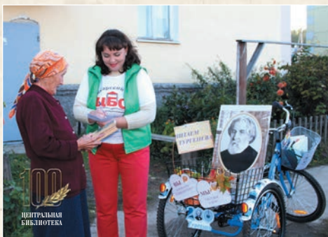
Первая велобiblioteca в Чувашии (2018 г.)

Впервые в Чувашской Республике в сентябре 2018 года в Центральной библиотеке появился велосипед. Проект «Велобiblioteca в Кугесях» направлен на продвижение книги среди жителей п. Кугеси, вовлечение людей в процесс чтения. Велобiblioteca обслуживает на дому пенсионеров, ветеранов, инвалидов, всех, кто самостоятельно не может посетить библиотеку. Летом велобiblioteca будет работать и на детских площадках.