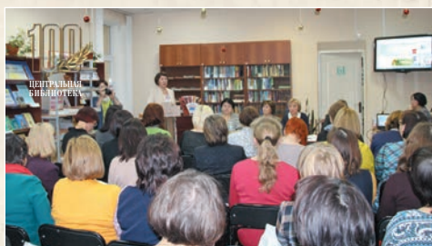
Республиканское совещание библиотекарей (2017 г.)

В 2017 году Центральная библиотека стала победителем VI Республиканского смотра-конкурса на лучшую общедоступную муниципальную библиотеку «Библиотека XXI века» в номинации «Библиотека – центр экологической информации и культуры», представив на конкурс проект «Информационно-экологический сайт «Экологическая страница Чебоксарского района Чувашской Республики». В том же году библиотека была награждена Дипломом победителя республиканского конкурса «Лучший библиотечный пункт года по обслуживанию незрячих читателей Чувашской Республики» в номинации «Лучший проект, посвященный библиотечному обслуживанию инвалидов по зрению» за успешную реализацию социально-культурного проекта «Книги, несущие свет».