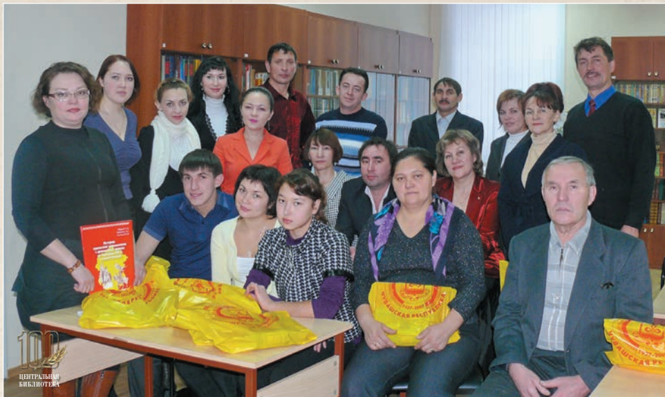
У нас в гостях – коллеги из Республики Татарстан (2013 г.)

В 2011 году Чебоксарская ЦРБ была преобразована в МБУК «Центральная библиотека» Чебоксарского района. Она стала ресурсным центром для сельских библиотек района, осуществляющим централизованное комплектование, обработку, учет фондов. Центральная библиотека также занималась формированием единого электронного каталога, методическим обеспечением библиотек района, межбиблиотечным книгообменом.