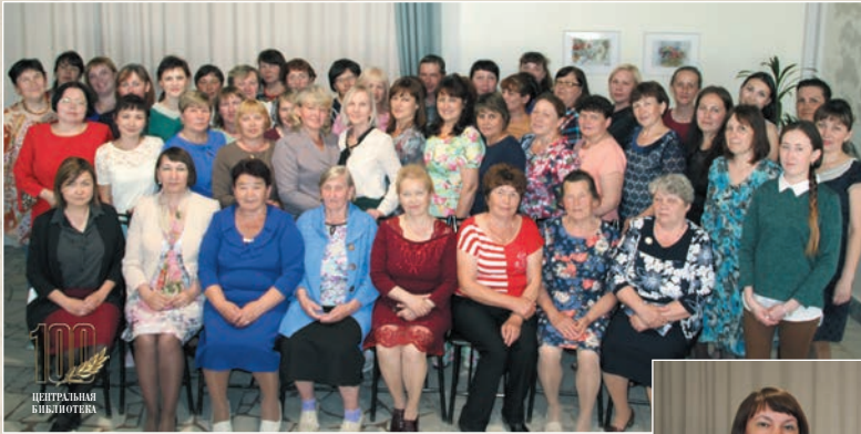
Молодежь и ветераны библиотечного дела (2018 г.)

За отличную работу – ценный сертификат (2018 г.)