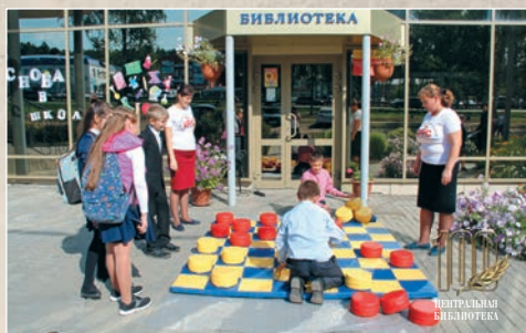
И шашечный путь ведет в библиотеку

Проект «Визитная карточка района – знаменитые земляки» принес библиотеке две победы в республиканском смотре-конкурсе на лучшую общедоступную муниципальную библиотеку Чувашской Республики «Библиотека XXI века»: в 2012 году в номинации «Лучшая библиотека по созданию информационных ресурсов» и в 2016 году в номинации «Центральная районная библиотека». В рамках этого проекта Центральной библиотекой создана мультимедийная коллекция из 12 электронных дисков.