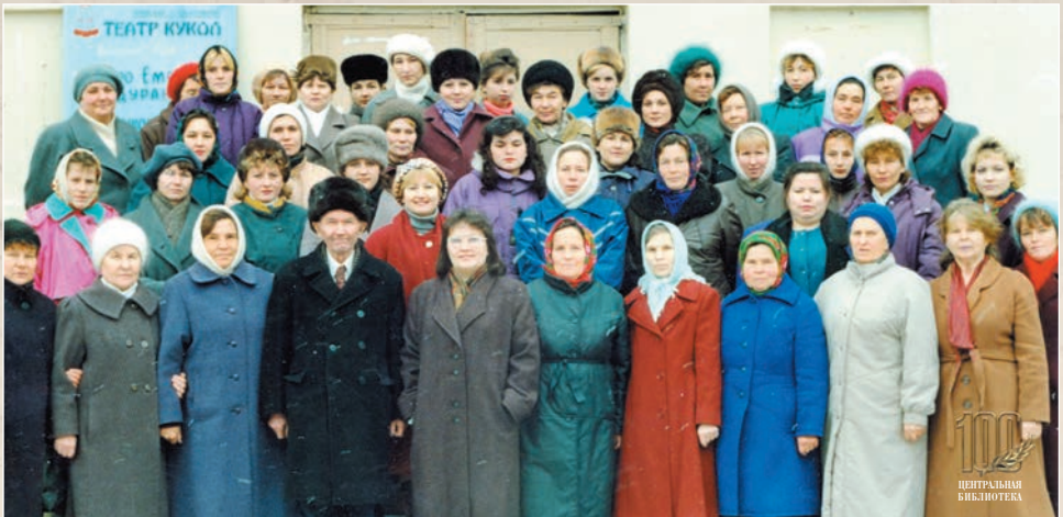
Коллектив библиотечарей Чебоксарского района (1994 г.)