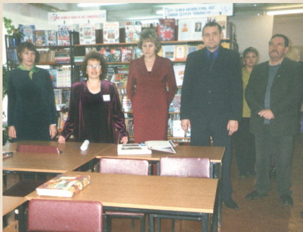
Открытие первой модельной библиотеки в д. Пархикасы. 2003г.

го района. На сегодняшний день доля библиотечного фонда, отраженного в электронном каталоге, составляет 100%. Район первым среди ЦБС республики достиг этой цифры. Постепенно библиотеки стали превращаться в новые информационные учреждения. Реализуя Указ Президента Чувашской Республики Н.В. Федорова «О создании сельских модельных библиотек в Чувашской Республике», 24 октября 2004 года в Чебоксарском районе открылась первая модельная библиотека. Ею стала Пархикасинская сельская библиотека. В библиотеке