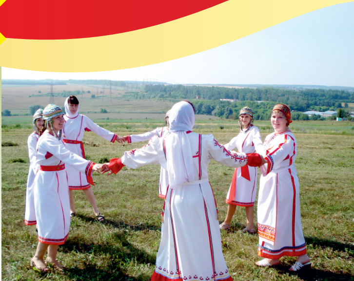
Библиотекари на съемках фильма о Чебоксарском районе. 2016г.