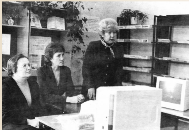
Министр культуры Чувашии Денисова О.Г. вручает Центральной библиотеке первый компьютер. 2002г.

С 2000 года библиотеки Чебоксарской районной ЦБС включились в мегапроект «Пушкинская библиотека». Фонды библиотек пополнились прекрасными изданиями по искусству, мировой культуре, учебными изданиями по экономике, праву, истории.