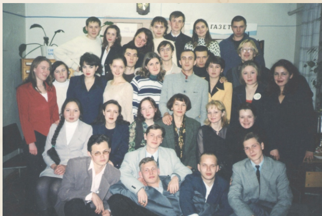
Члены молодежного спор-клуба «13-й дом» при Центральной библиотеке. 1998г.

Большое внимание в библиотеках уделялось организации досуга молодежи. В Центральной библиотеке начинает работать клуб для молодежи «13-й дом», деятельность которого в последующие годы стала известна на всю республику. В клубе проводились вечера, посвященные творчеству поэтов и писателей, встречи с известными специалистами своего дела, спор-часы. Главной целью работы клуба стала организация досуга молодежи, приобщение к чтению и книге.