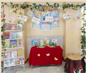
Выставка в Центральном доме культуры. 2016г.