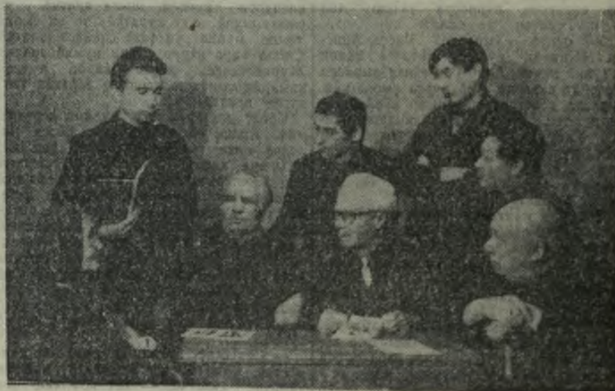
«Сѣрѣмсан» литература пѣрлѣшѣвѣнче.

Суллахи тѣлек кун. Курѣнмаѣс хирте чун. Сар хѣвел сѣс тѣратѣ шѣранса. Колхоз уйѣ умра, вѣс-хѣрри те ун сук, Тырѣ-пулѣ юхатѣ хумханса.