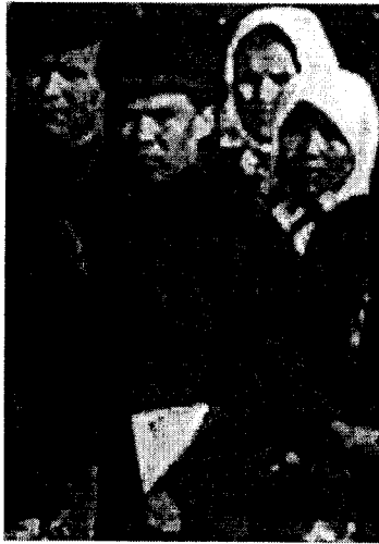
Михаил Сеспель. 17 апреля 1921 г. (фрагмент групповой фотографии).

Я не сомневаюсь, что найдутся со временем еще несколько фотографий М.Сеспеля. Ведь до сих пор неизвестна судьба двух пакетов с фотокарточками, дневниками и другими документами, которые решением Ревтрибунала ЧАО в августе 1921 г. было решено вернуть после суда поэту. Однако он их так и не получил.