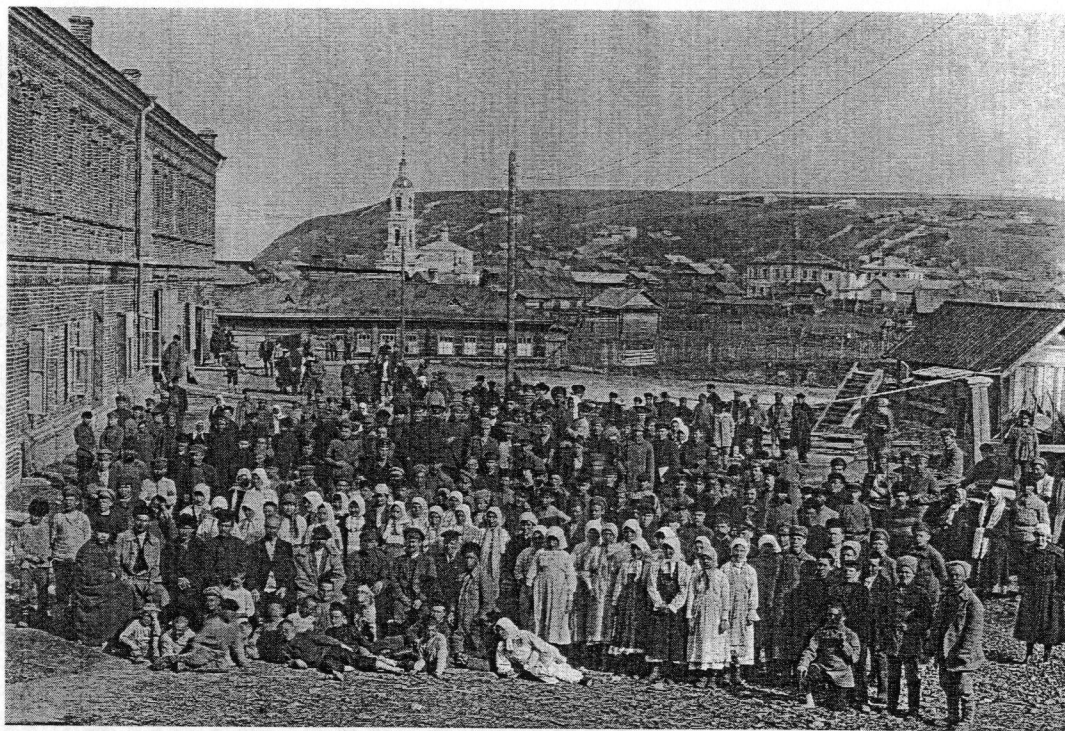
Участники торжественного заседания перед зданием Чувашского театра. 17 апреля 1921 г.