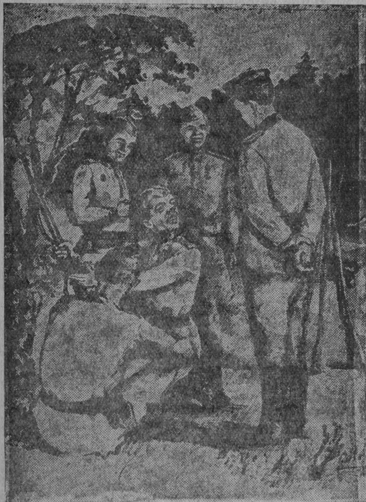
Терентьев сѣмах хушмасѣр чайгаимарѣ