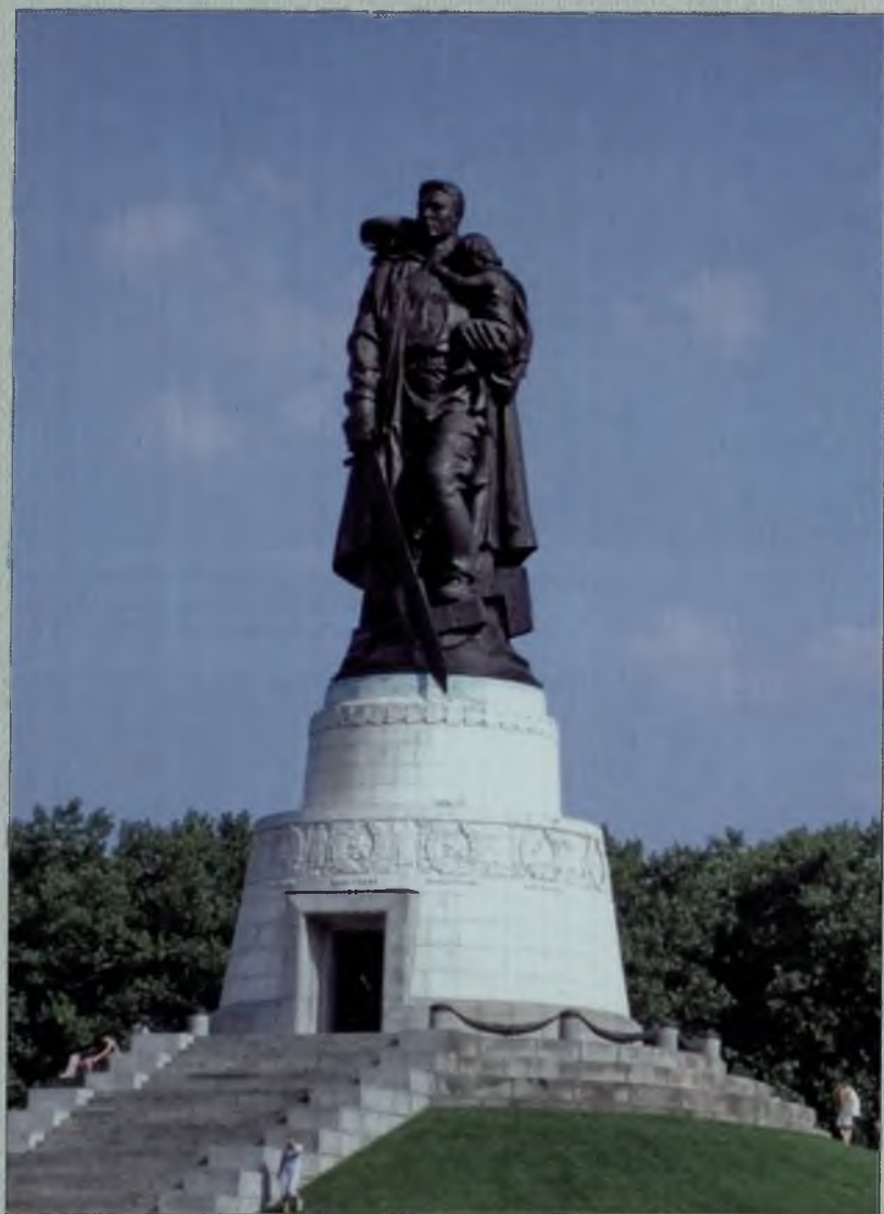
Германия, г. Берлин, Трептов-парк. Памятник советскому солдату-освободителю со спасённой немецкой девочкой на руках. Автор Евгений Вутечич.