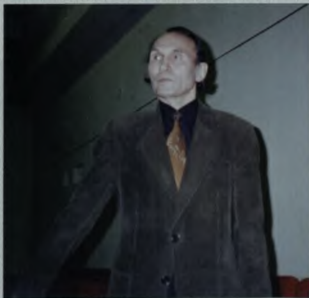
Прощай, XX век!