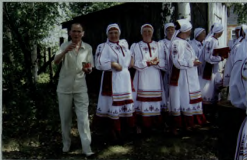
На празднике “День деревни” в честь 75-летия поэта. д. Пуснаркасы – Малое Шигаево. Июнь 2010 г.