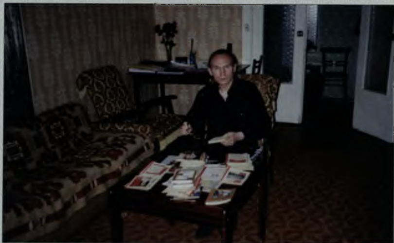
Размышления о мире, России...