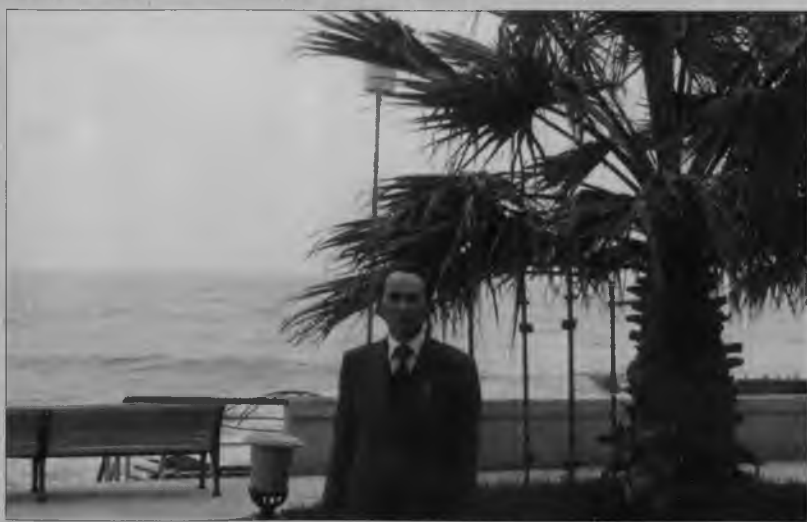
У моря под пальмой. г. Сочи. 2005 год.