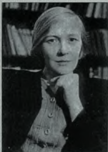
Поэтесса Ольга Берггольц

Первому секретарю Центрального Комитета Коммунистической партии Кубы товарищу Фиделю КАСТРО РУС