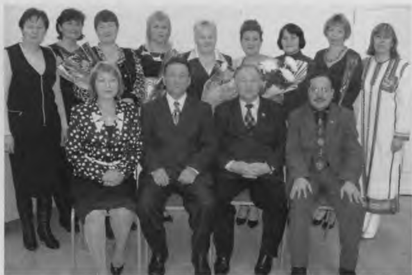
Тăван чѣлхе вѣрентўсисен конкурсѣ. Ульяновск.