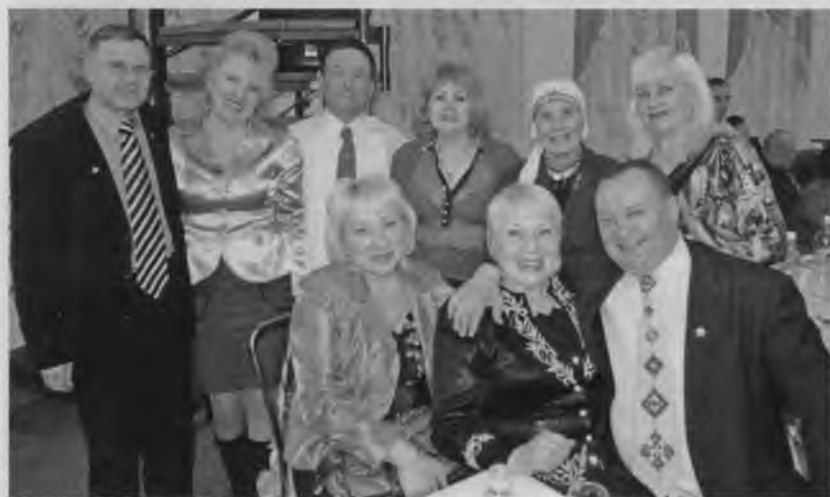
Чăваш наци конгресѣ хыҫҫăн. Шупашкар.