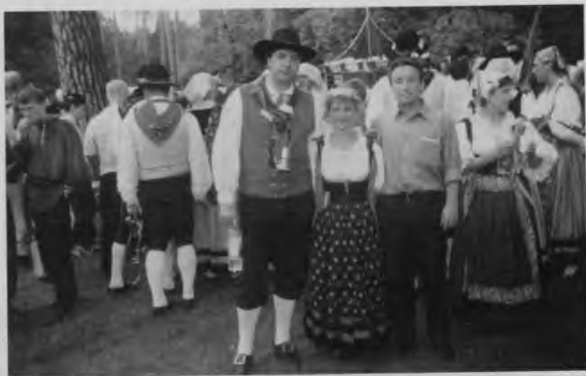
Итали артисчĕсемпе. Акатуй, Шăмăршă, 2003.