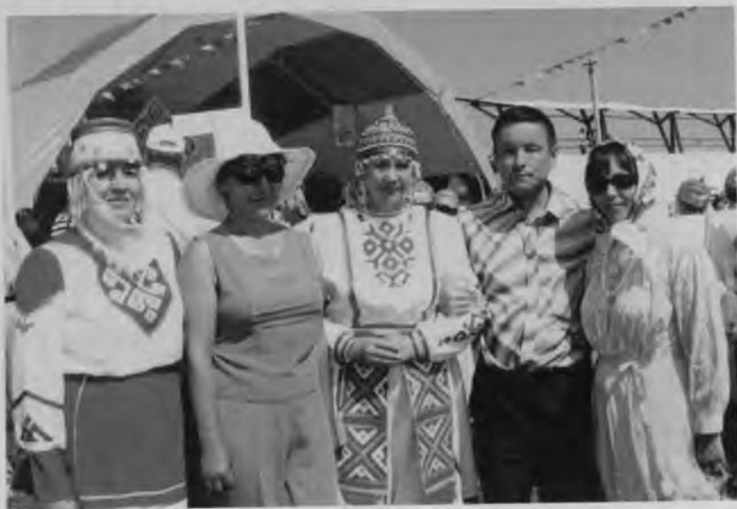
Уяв. Тугарстан, Нурлат, 2008.