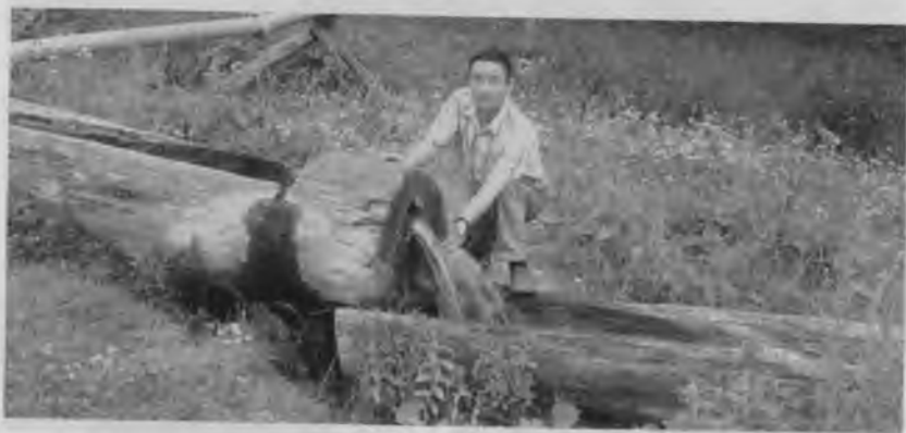
Џалку' шывё тутл'а-ске! Ч'аваш Ен, Т'авай районё, С'х'ятпу'с ялё.