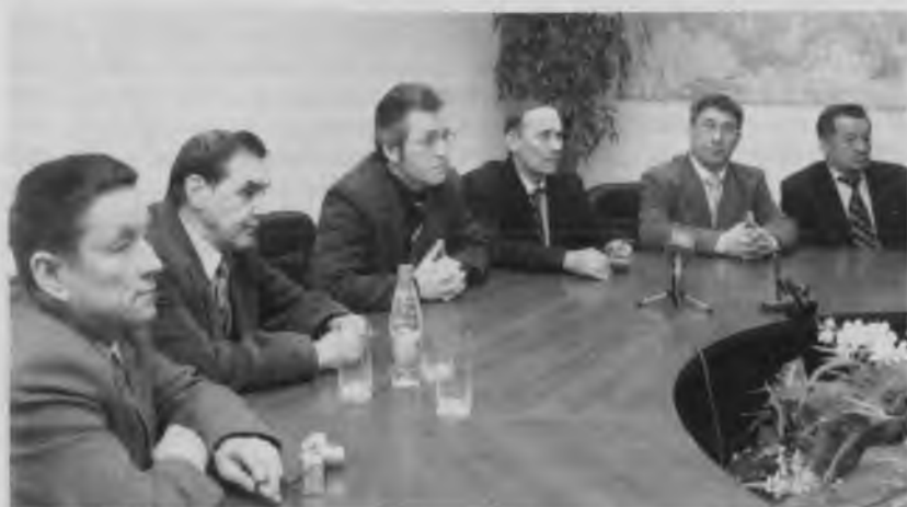
Массалла информаци хатёрёсен ёсченёсен җавра сётелё. Хусан.