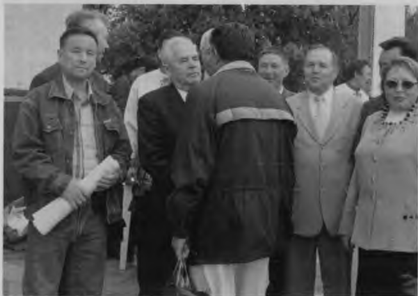
А.Г.Николаев космонавтпа пёрле. Мускав. Акатуй. 2004.