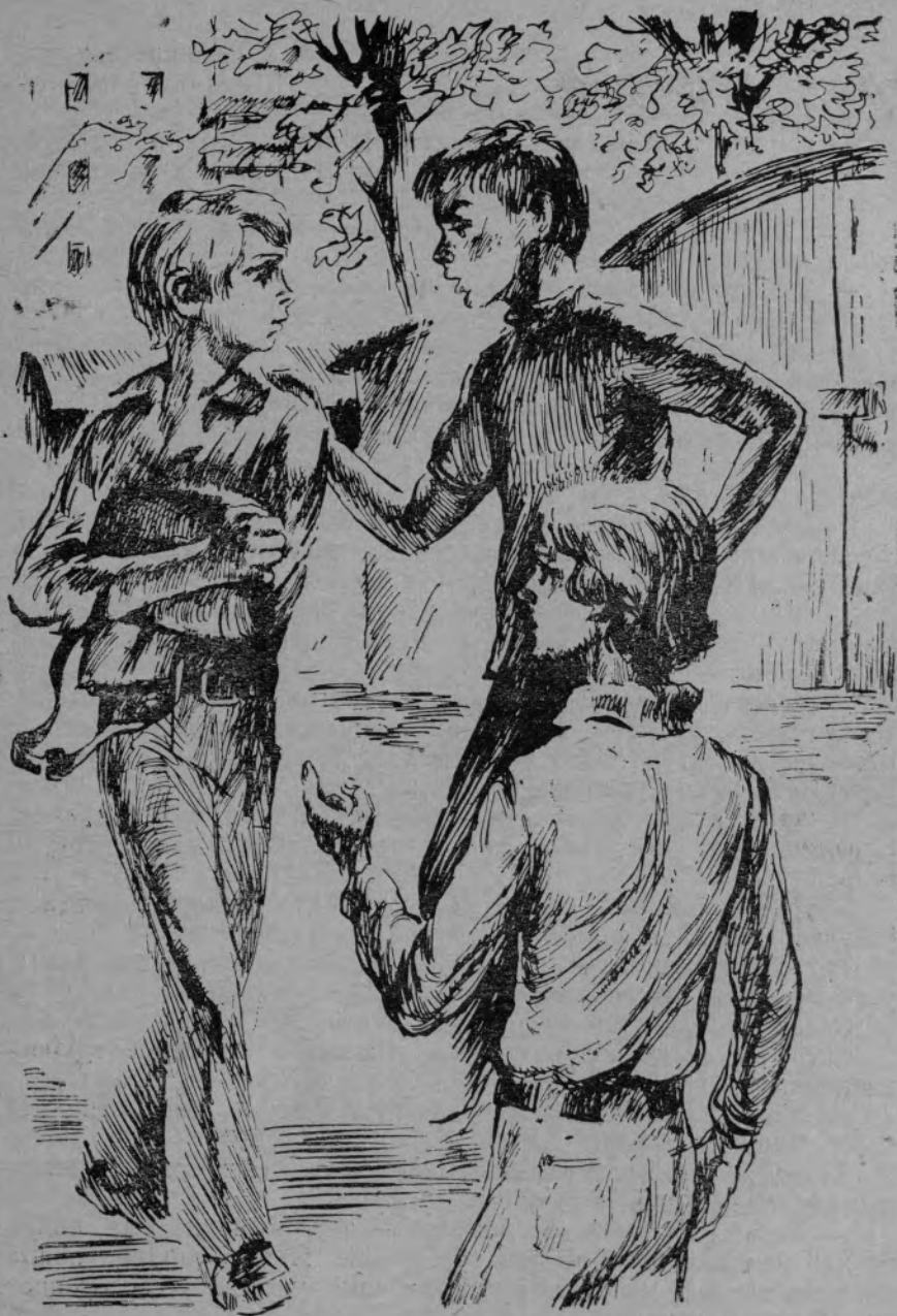
3. Яал кулсан.