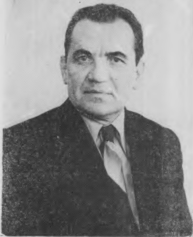
Леонид Яковлевич Агаков (1910—1977) Чăваш Республикинче Етёрне районьнчи Çуткассинче çуралнă. Вăл утмăл ытла кёнеке çырса пичетлесе кăларнă. Л. Я. Агаков — чăвашсен паллă прозаикё, драматургё, публицисчё. Писатель ачасем валли те пайтах произведени çырна. Л. Я. Агаков — чăваш халăх писателё.