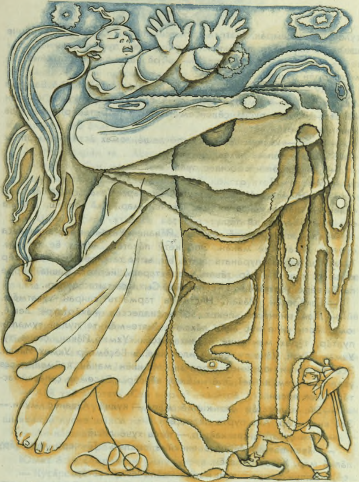
— Пятикнижие таксама петерден. Э-я мүдүрүсүмүш төмөндө