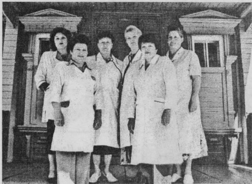
Работники детской консультации Большенагаткинской ЦРБ.