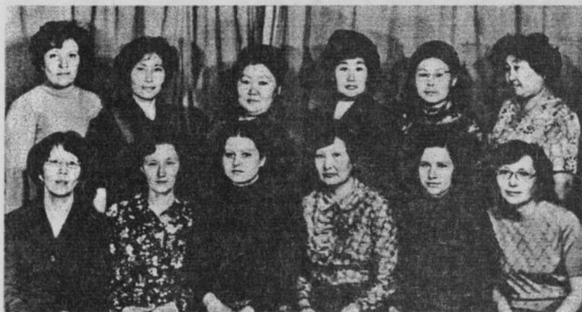
Группа врачей Среднеколымской ЦРБ, 1980.