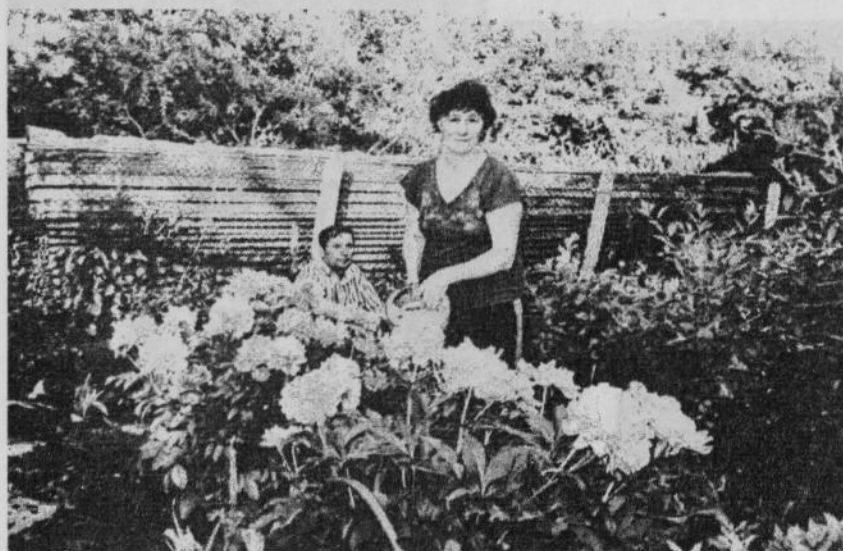
Уход за цветами.