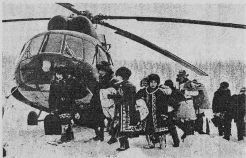
У оленеводов. Якутия.