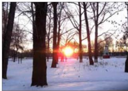
Утро в лесу