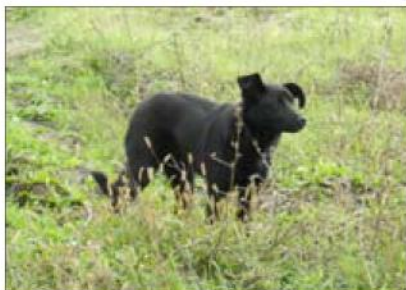
В ожидании хозяина

поняв, что не догнать, вернулся обратно. Он суетливо бегал возле остановки, нюхал землю, траву и все лежащее на ней, наконец сел, жалобно поскуливая. Подошел я осторожно. Вытащил из кармана пиджака кусок хлеба, дал ему. Он даже голову не повернул, продолжал тоскливо смотреть вслед автобусу.