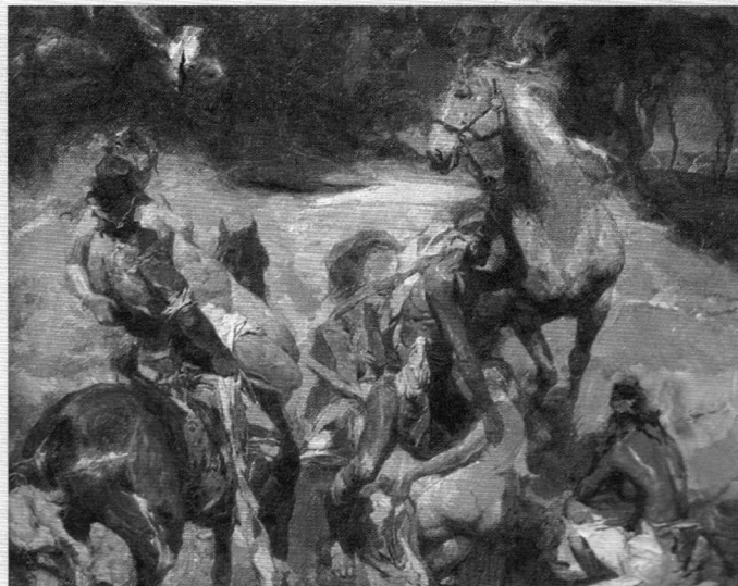
"Хӗр вӑрлани", 2002 ҫ.